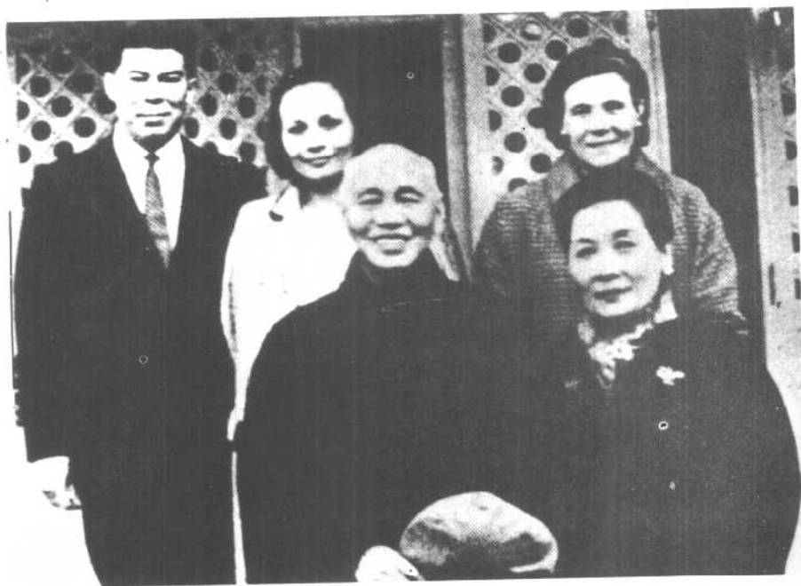
蒋介石、宋美龄与长媳方良及孙女、孙婿。