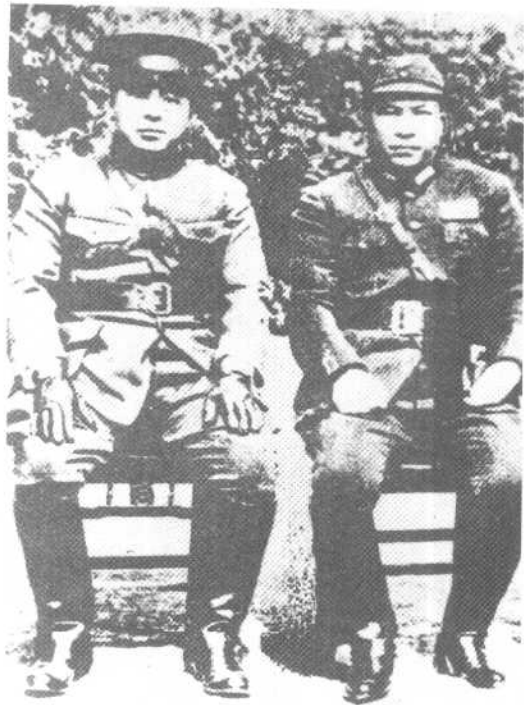
西安事变前，张学良与杨虎城合影。这是两人的最后一张合影。