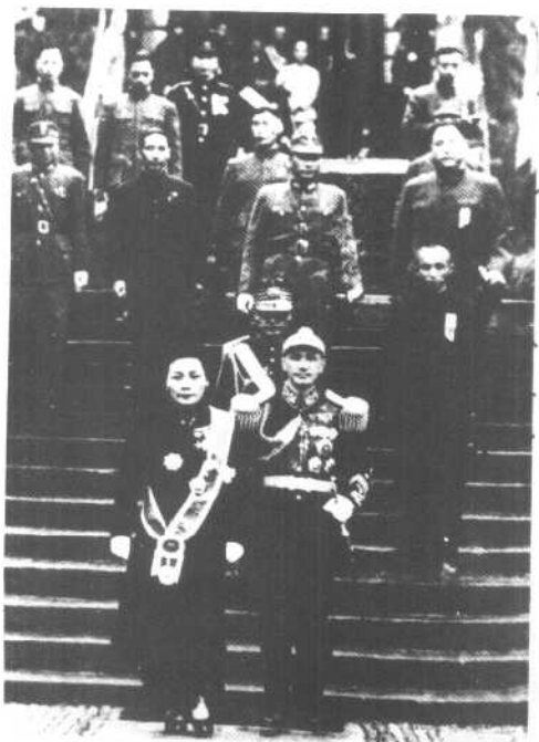
一九四三年蒋介石就任 国民政府主席后，与宋美龄 步出礼堂。