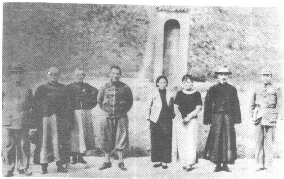
1934年10月21日，张学良陪蒋介石游茂陵。