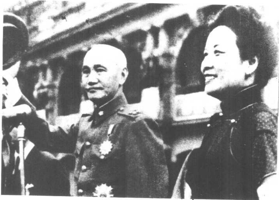
一九五〇年三月一日， 蒋介石以“惟国民之公意” 为由宣告复出。