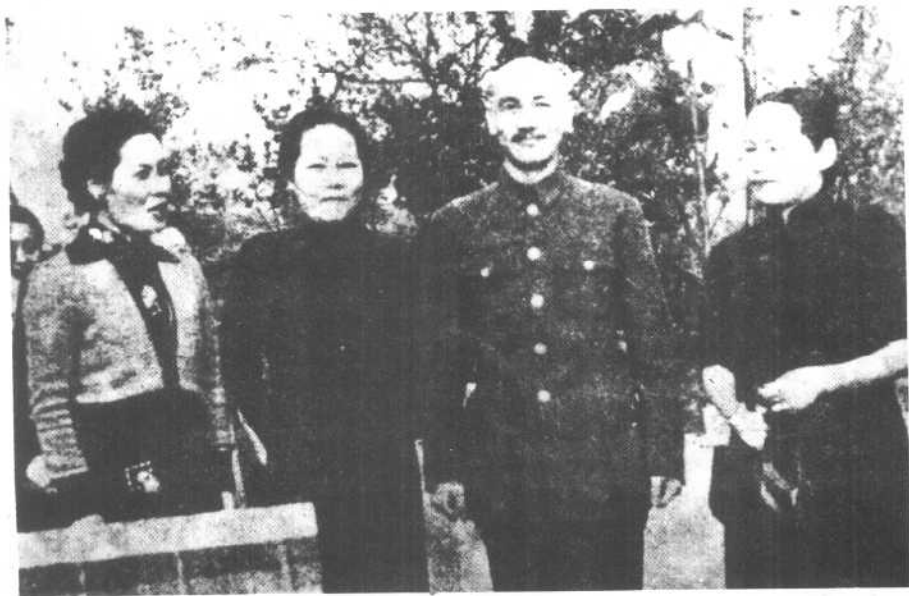
蒋介石与宋氏三姐妹。