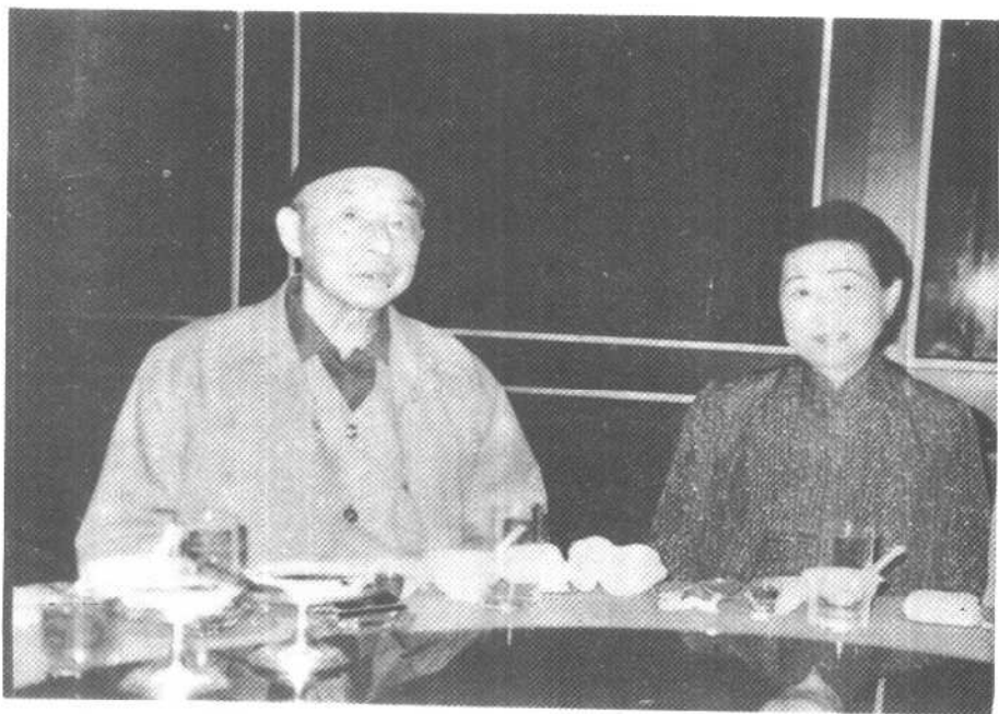
1988年，张学良与夫人赵绮霞合影。