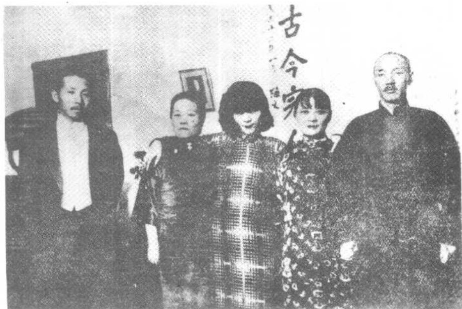
左起：张学良、宋霭龄、于凤至、宋美龄、蒋介石。