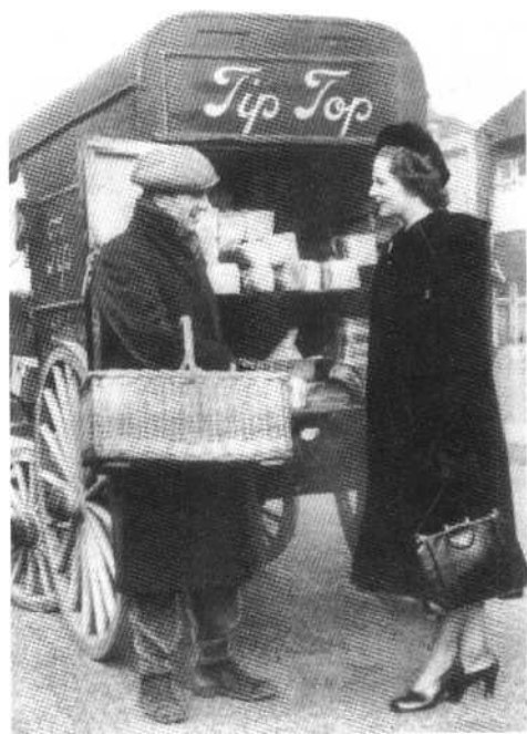
首次当选为达特福选区的保 守党候选人(1951年)