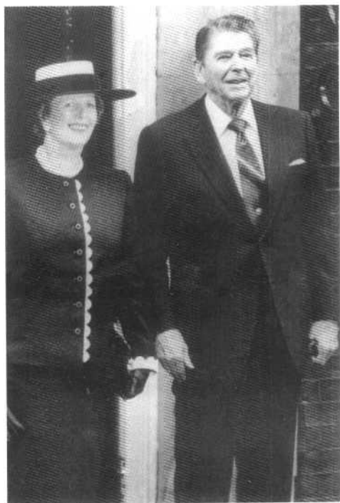
与里根总统在唐宁街 10 号门前