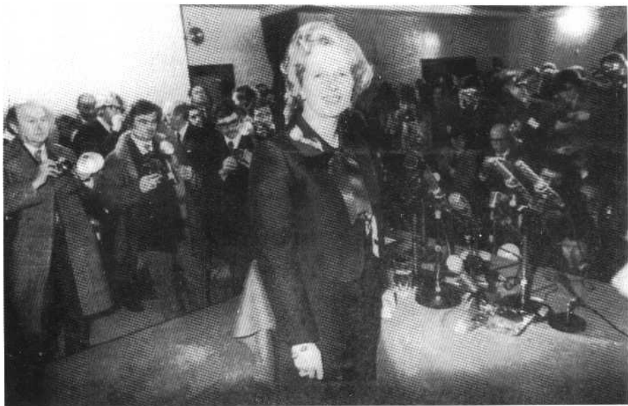
在 1975 年保守党年会，撒切尔夫人作为党的新领袖发表演说，获得成功