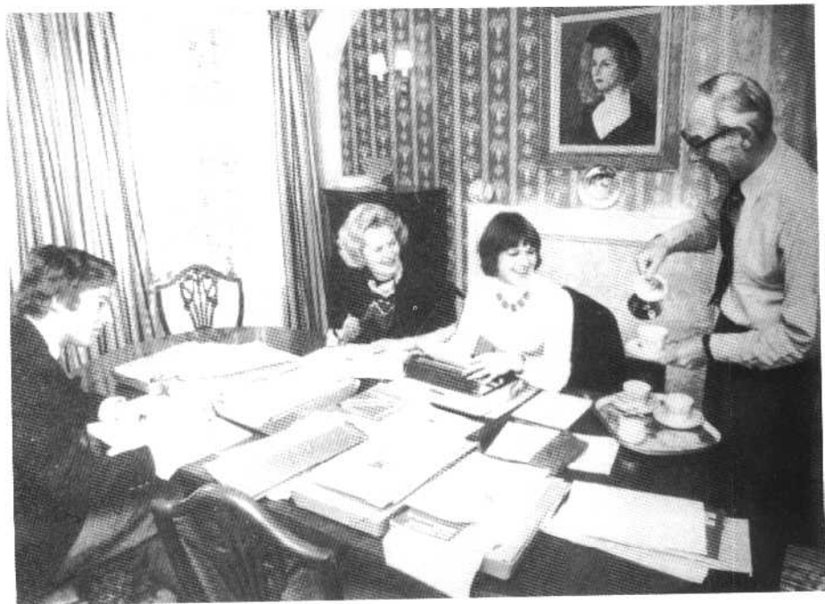
与家人一起为竞选保守党领袖做准备(1975年)