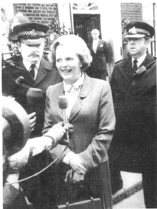
赢得大选的撒切尔夫人在唐宁街 10 号门前接受采访(1979 年 4 月)