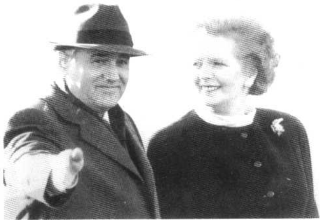
与戈尔巴乔夫在一起