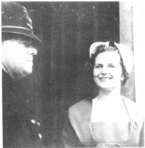
新当选的下议院议员玛格丽特·撒切尔选举结束后来到下议院(1959年)