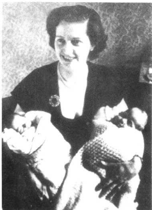
撒切尔夫人和她的双胞胎 婴儿:马克和卡罗尔