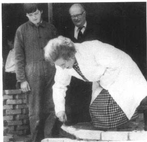
与建筑工人在一起