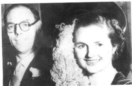
玛格丽特·撒切尔和丈夫丹尼斯·撒切尔在婚礼上