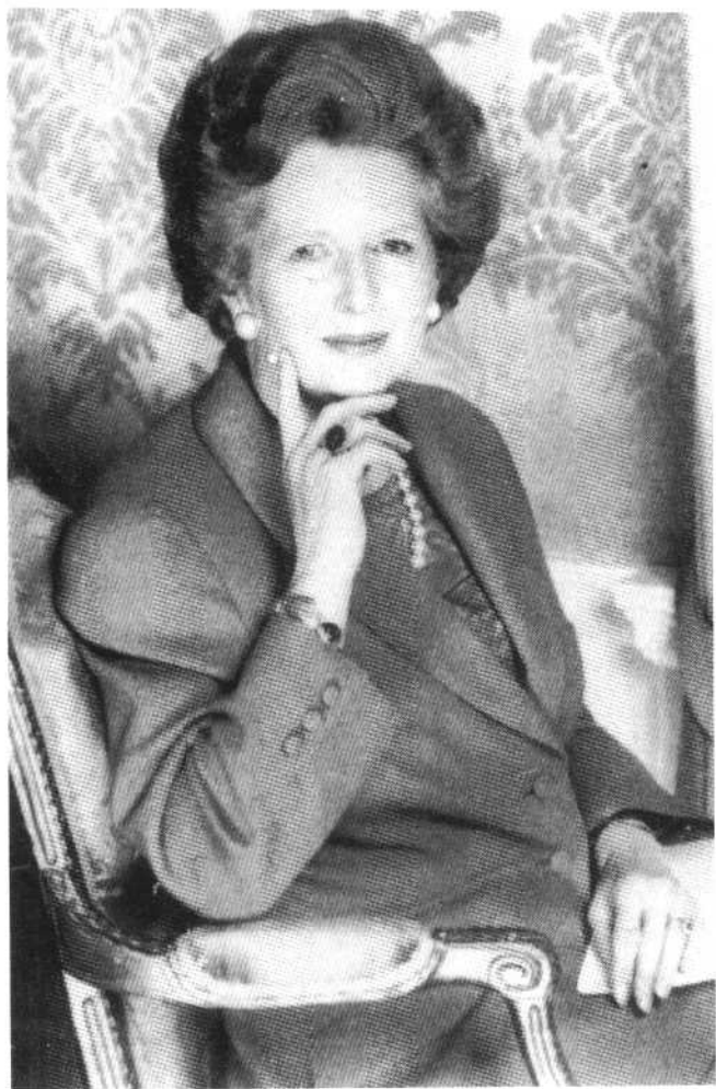
神态雍容的铁娘子