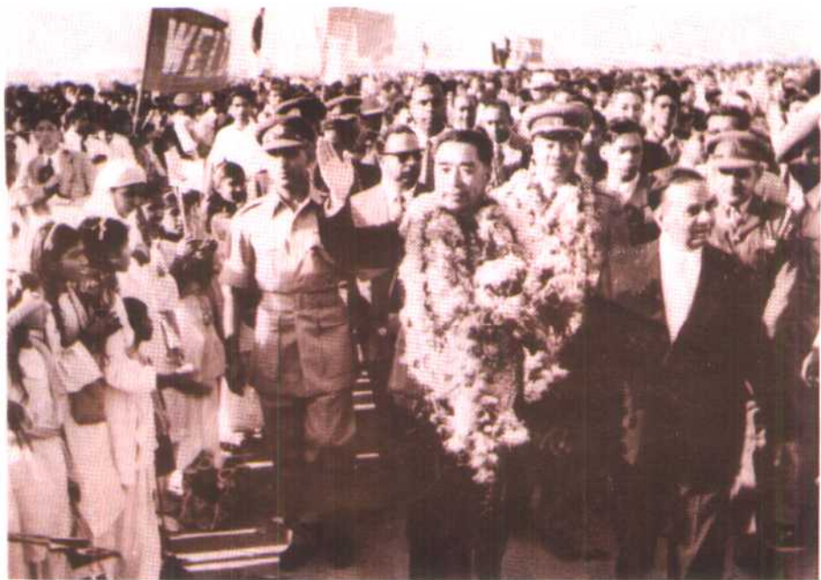
1956年周恩来总理、贺龙副总理出访巴基斯坦。