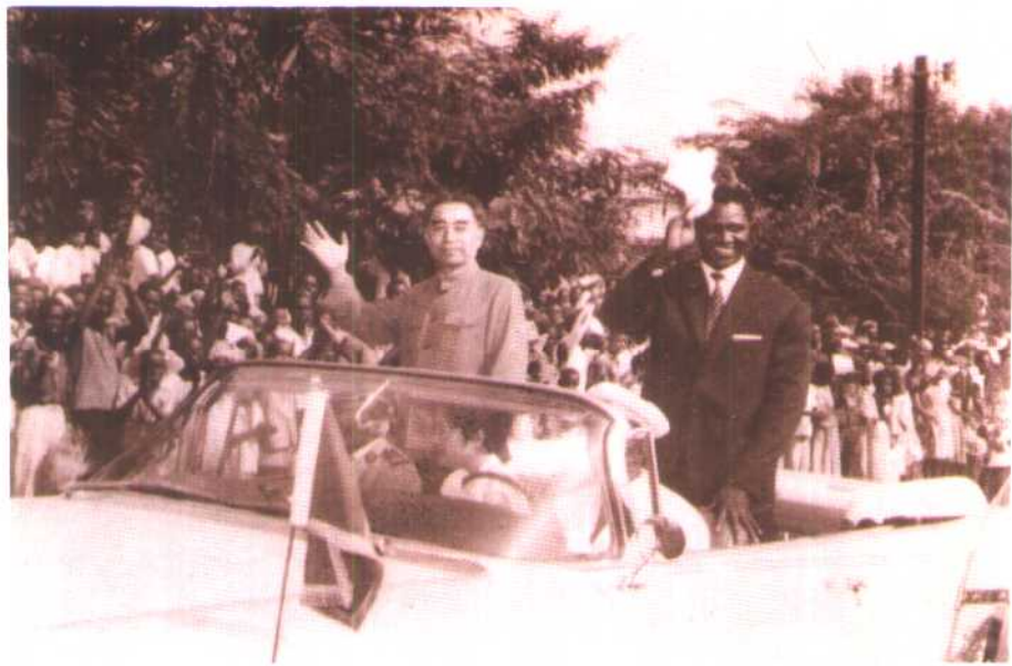
1964年1月，周恩来总理在几内亚总统塞古·杜尔陪同下向欢迎群众招手致意。