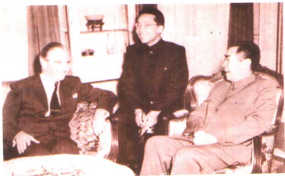
1954年5月，周恩来总理兼外长在出席日内瓦会议期间同英国外交大臣艾登会谈。