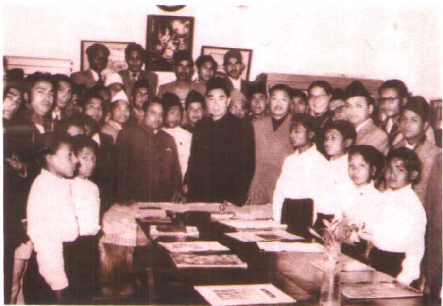
1957年周恩来总理、贺龙副总理出访尼泊尔。