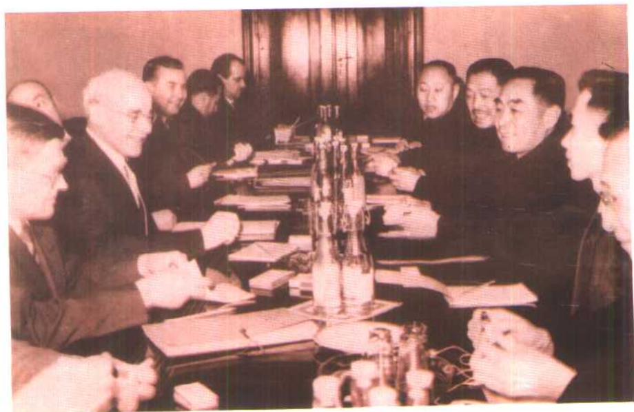
1957年1月，周恩来总理、贺龙副总理访问波兰，同波兰领导人哥穆尔卡等举行会谈。