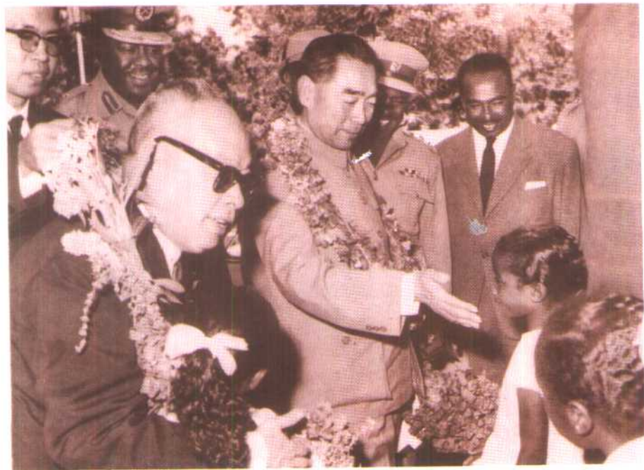
1964年1月，周恩来总理、陈毅副总理出访撒哈拉以南的国家——苏丹。