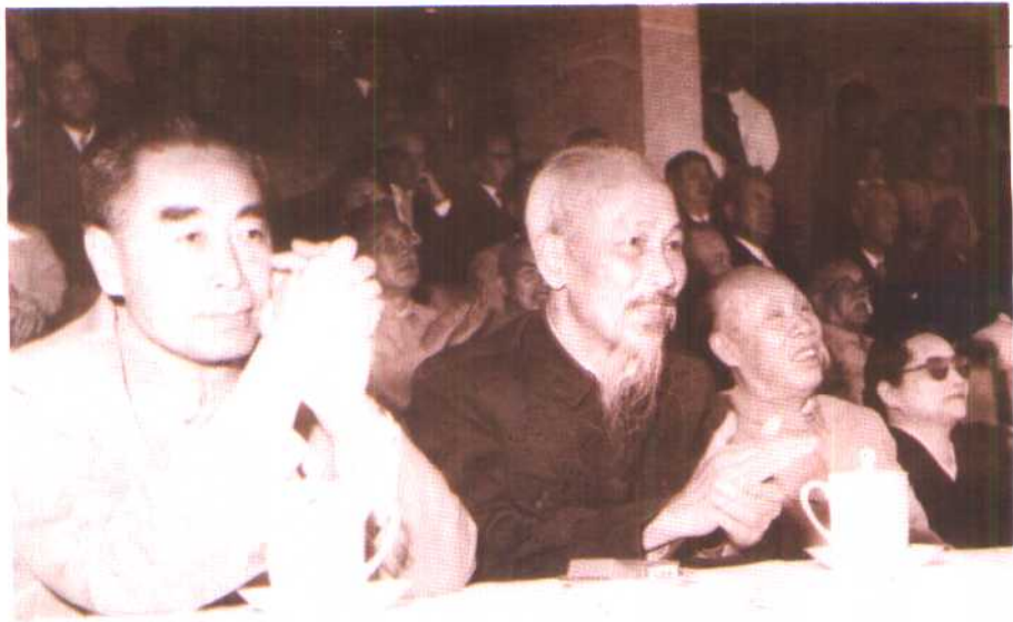
1959年10月，周恩来总理和胡志明主席。