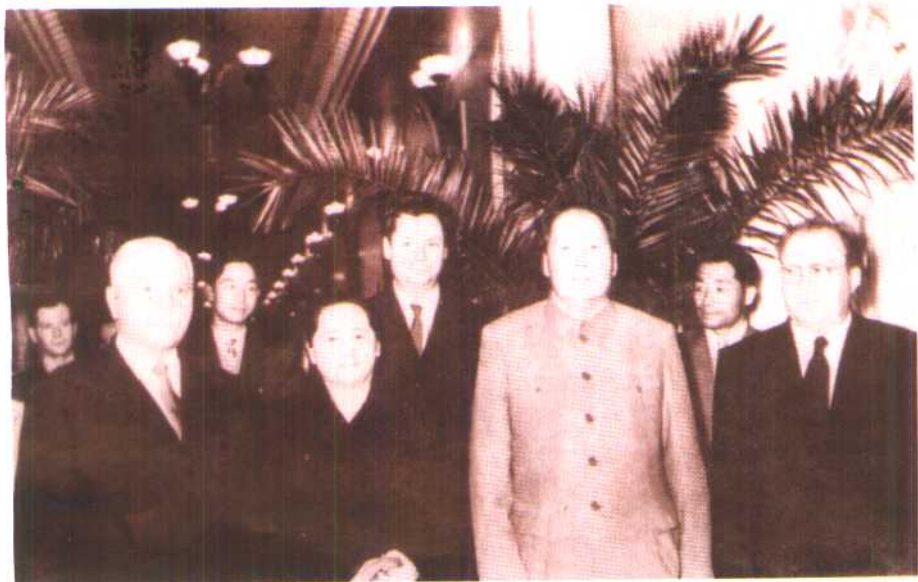
1957年11月，毛泽东、宋庆龄在克里姆林宫同伏罗希洛夫合影。