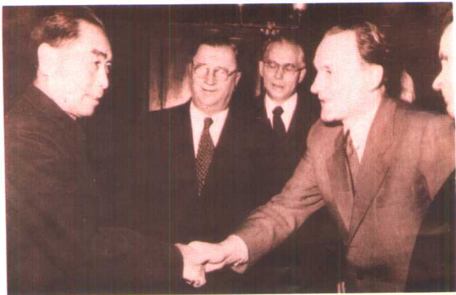
1957年1月，周恩来总理访问匈牙利，与卡达尔总理握手。