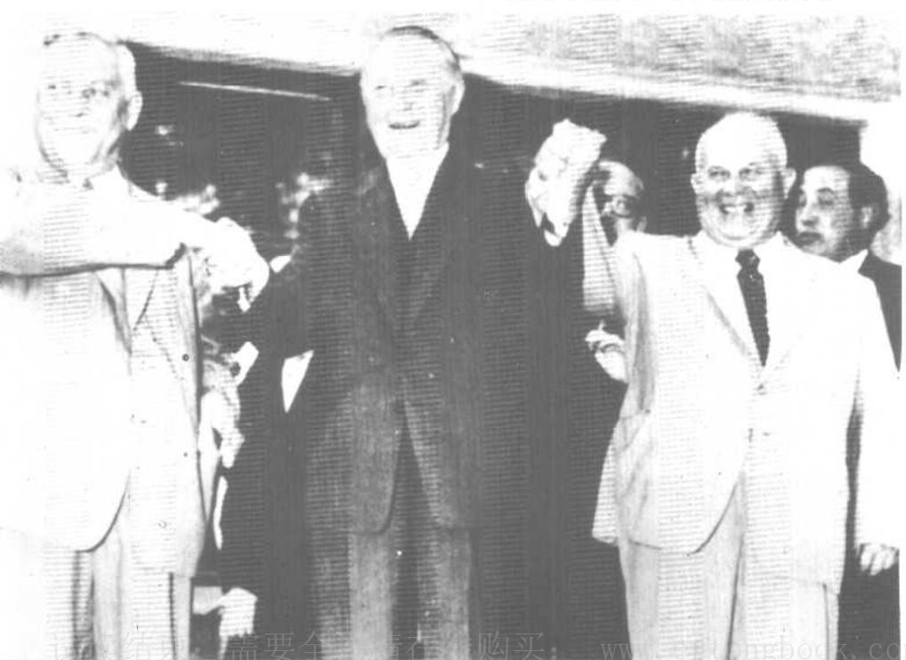
下：阿登纳与布尔加宁、赫鲁晓夫在莫斯科