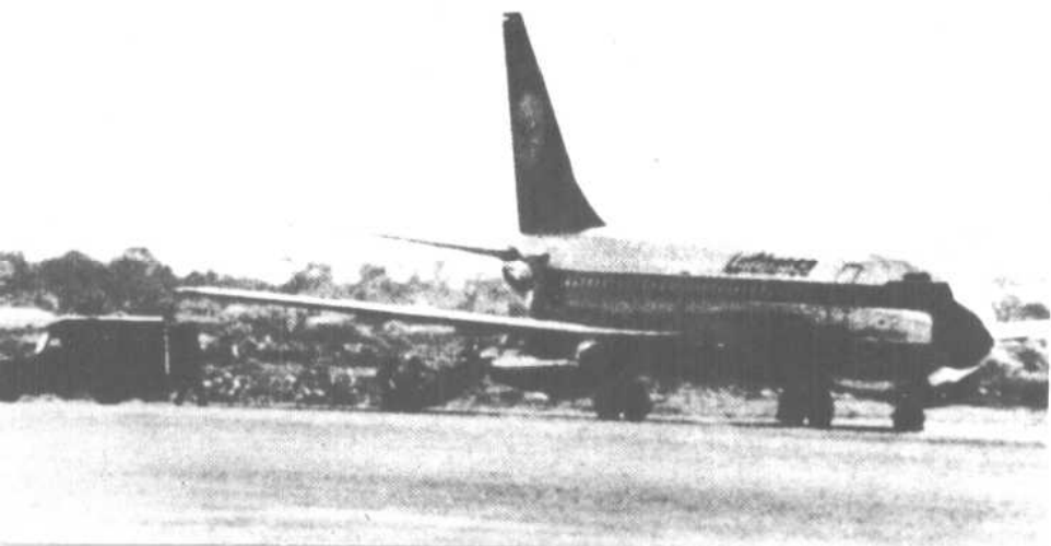
下：一九七七年在索马里摩加迪沙机场上的 “兰茨胡特”号客机