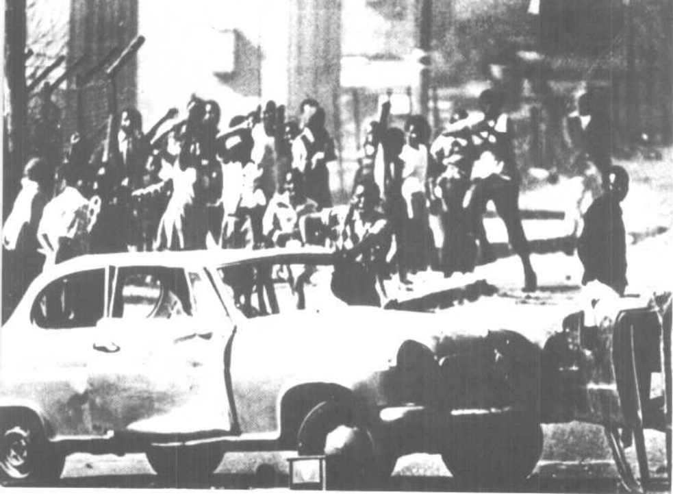
上：一九七六年南非索韦托的动乱