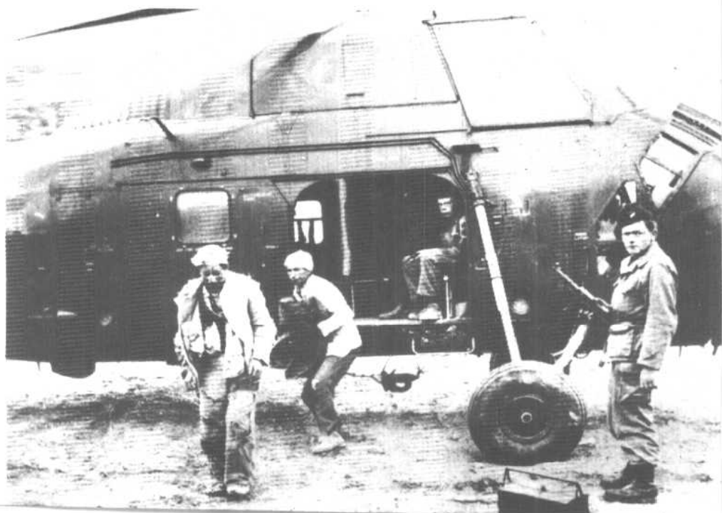
下：一九五六年阿尔及利亚被俘的起义者