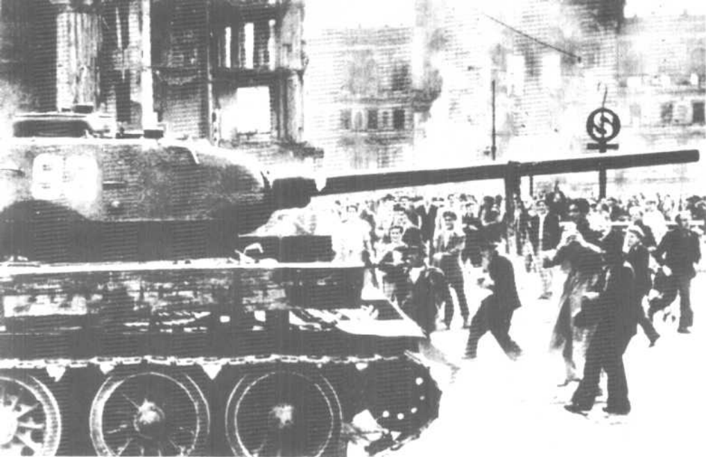
上：一九五三年六月十七日的柏林