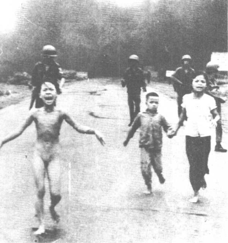
下：切尔诺贝利已损坏的核反应堆（一九八六年） 上：越南的金福姑娘（一九七三年）