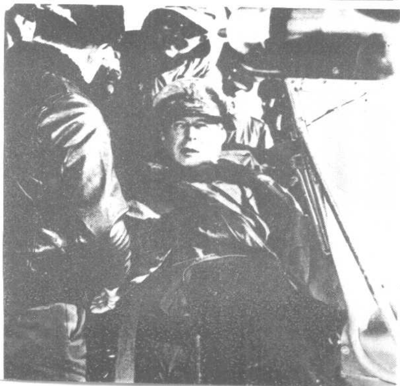
下：麦克阿瑟将军在朝鲜（一九五一年） 上：斯大林、杜鲁门和丘吉尔在波茨坦（一九四五年）