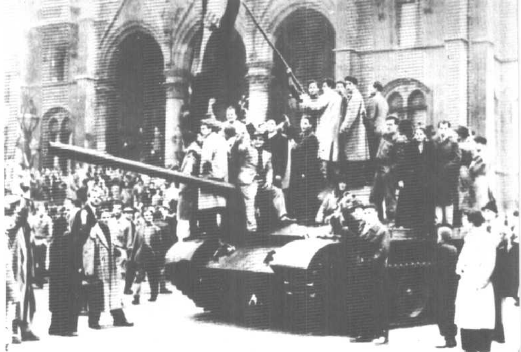
上：一九五六年匈牙利事件