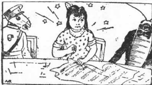
○ 文條碎撕嬰思麗阿