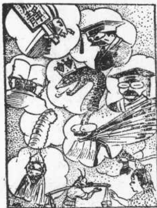
○ 可視多式事