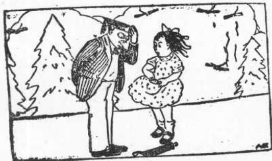
○ 編有沒真真袋思麗阿見看士博發