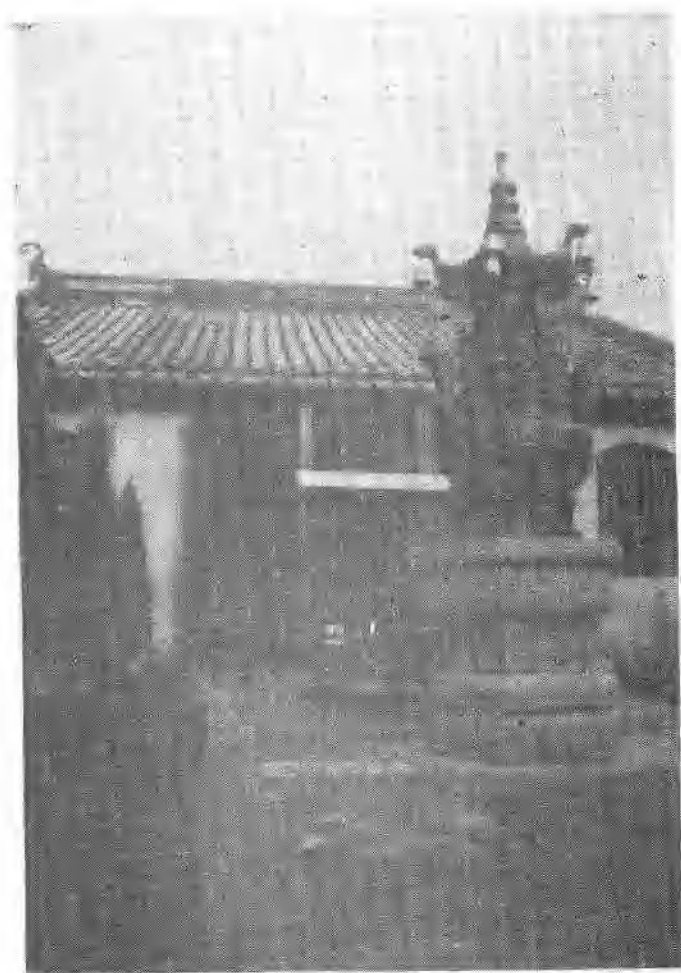
周庄镇澄虚道院