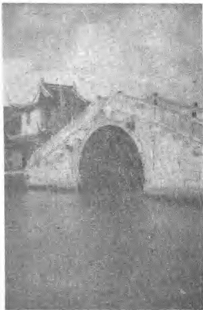
陆家镇龙王庙、沪读通济桥