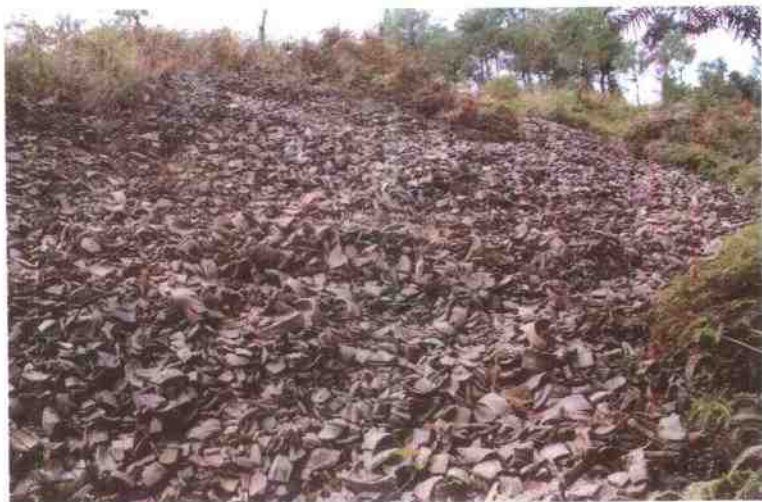
沙埠青瓷窑址之堆积层