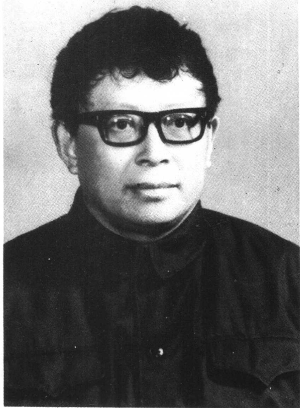
來 蕪 同 志 遺 像