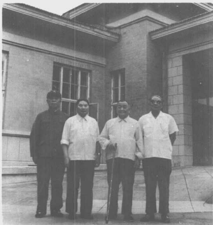
一九七九年， 刘震（右一）、 谭政（右二）、 杨得志（左二） 在一起。