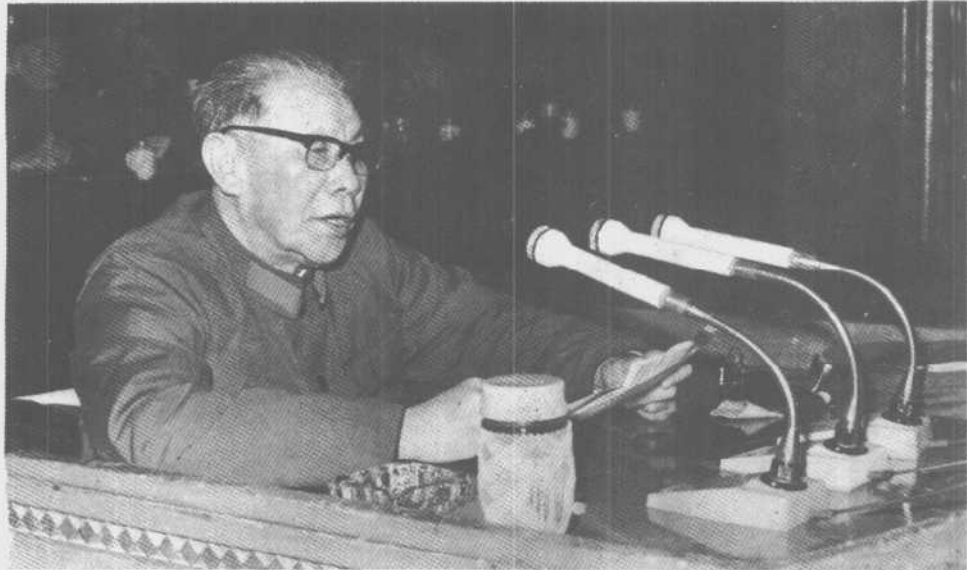
一九七八年八月，刘震在新疆军区传达党的十一届全国代表大会盛况。