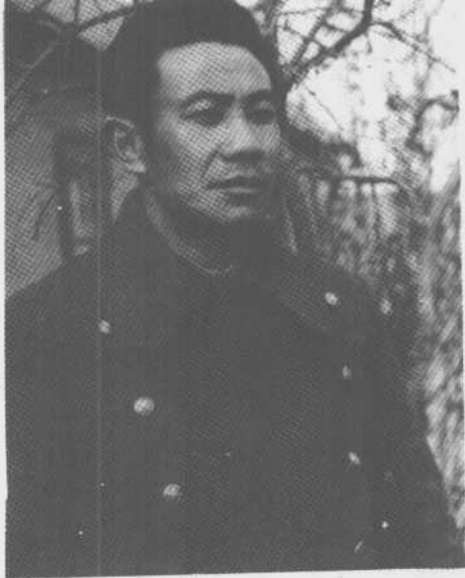
抗日战争 时期的刘震。