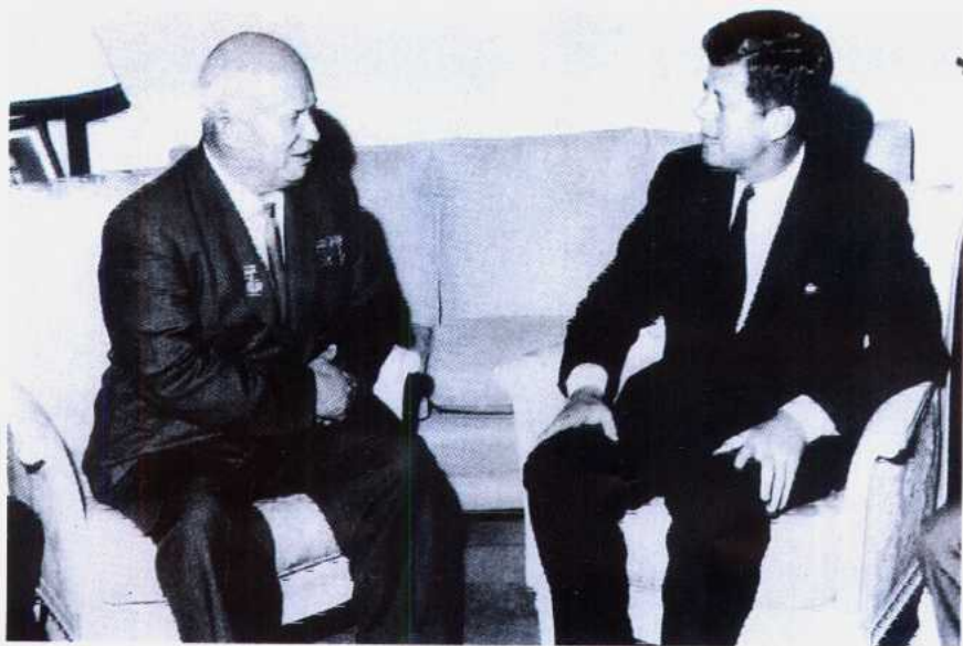
1961年6月，美国总统肯尼迪与苏共中央第一书记赫鲁晓夫在维也纳举行首脑会晤。