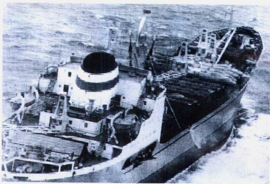
苏美秘密达成妥协，美国保证不进攻古巴，苏联则撤走导弹。图为在美国军舰监督下，苏联船只从古巴运走了导弹。