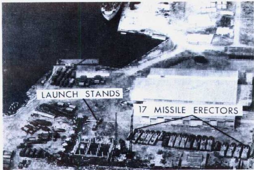
U-2拍摄的苏联在古巴建设的一个中程导弹发射场。