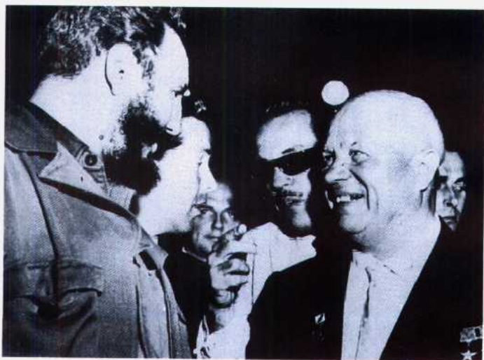
1963年4月，卡斯特罗访问苏联，受到赫鲁晓夫的热情欢迎。