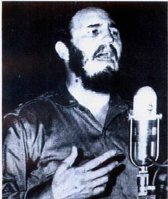
1961年4月，美国训练的古巴流亡者军队在猪湾 登陆，被古巴政府军全歼。卡斯特罗发表讲话，强烈 谴责美国帝国主义的侵略本性。