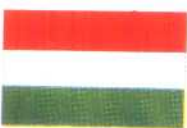
匈 牙 利