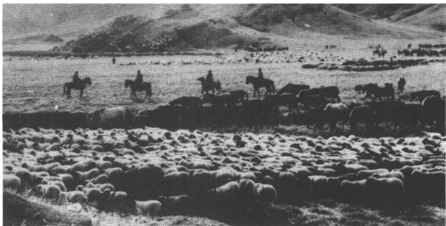
↑ 民主改革后欣欣向荣的牧区。