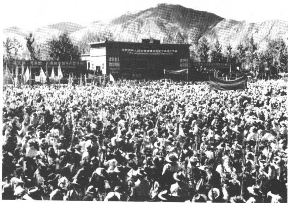
↑ 1965年9月1日拉萨各界隆重集会庆祝西藏自治区成立。