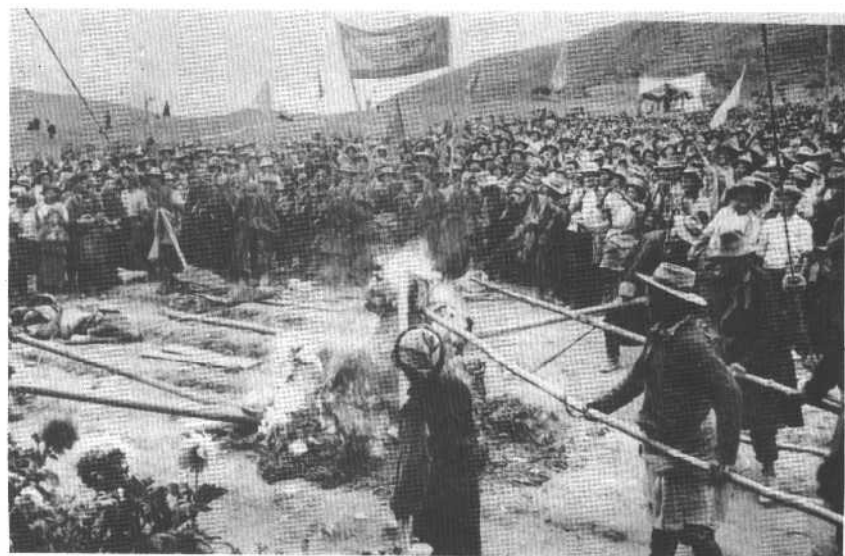
← 翻身农奴在民主改革中烧毁反动文契。