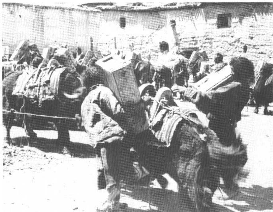
↑ 藏族群众积极支援平叛。