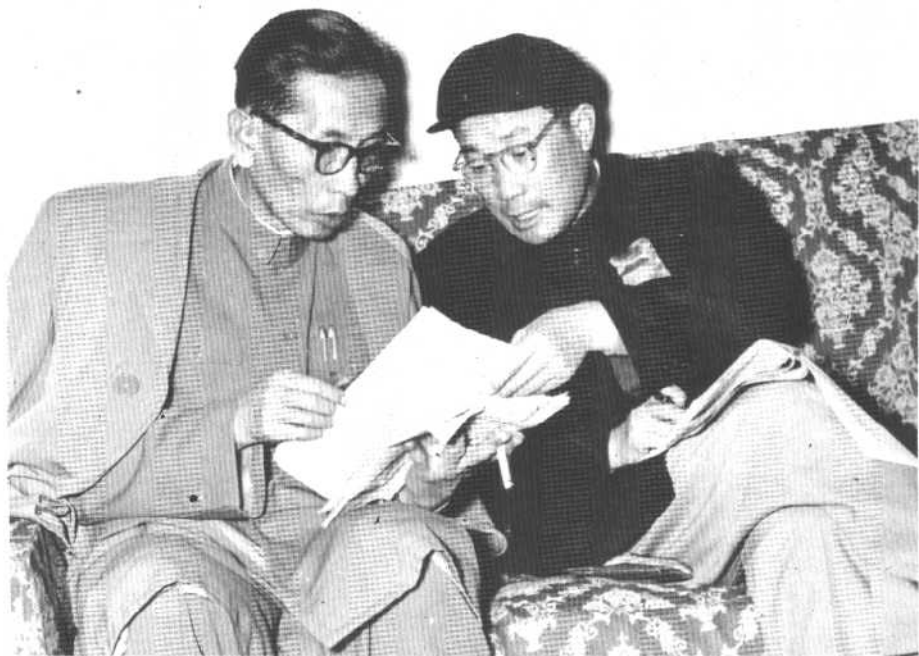
↑中共西藏工委书记、西藏军区司令员张国华和阿沛·阿旺晋美在研究工作。