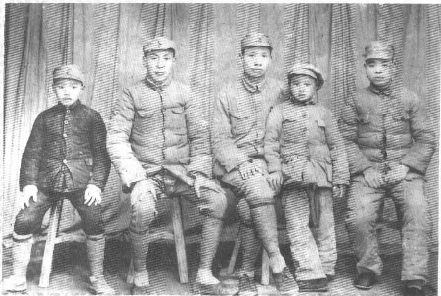
1938年于延安。左起：刘允斌、刘云庭、刘少奇、刘爱琴、刘允明。