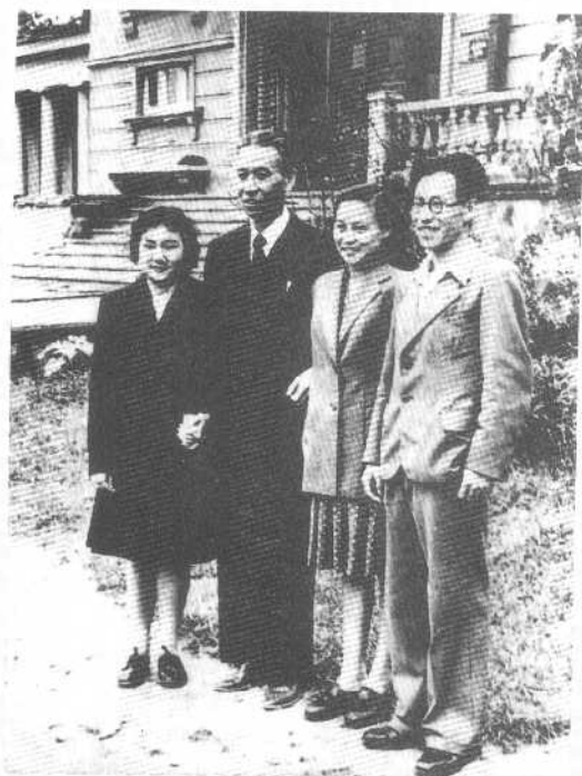
1949年于莫斯科。从左至右：朱敏、刘少奇、刘爱琴、刘允斌。