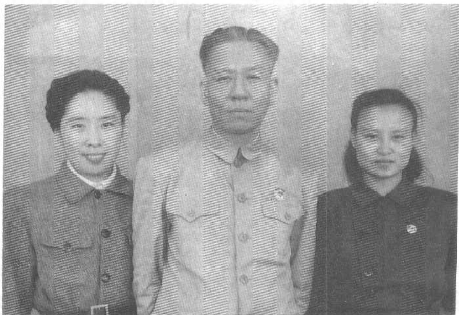
1949年秋于北京，王光美、刘少奇、刘爱琴。