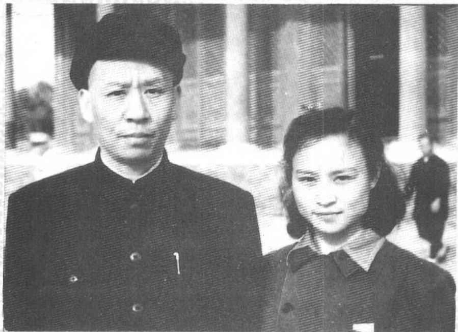
1951年同父亲刘少奇在北京。