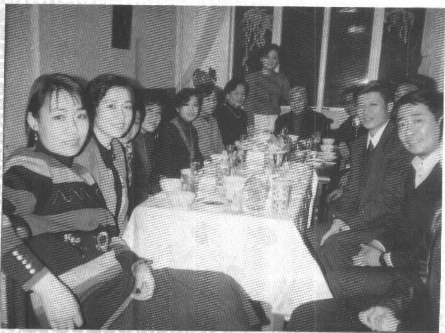
1993 年春节全家合影，坐在正中的是王光美。