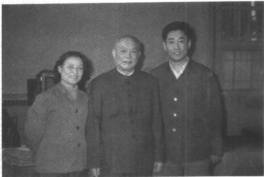
1980 年于 北京同李先念 在一起。