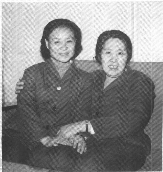
1980 年于 北京同王光美 在一起。