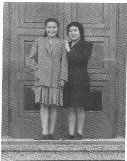
1949年刘爱琴 和朱敏在莫斯科。