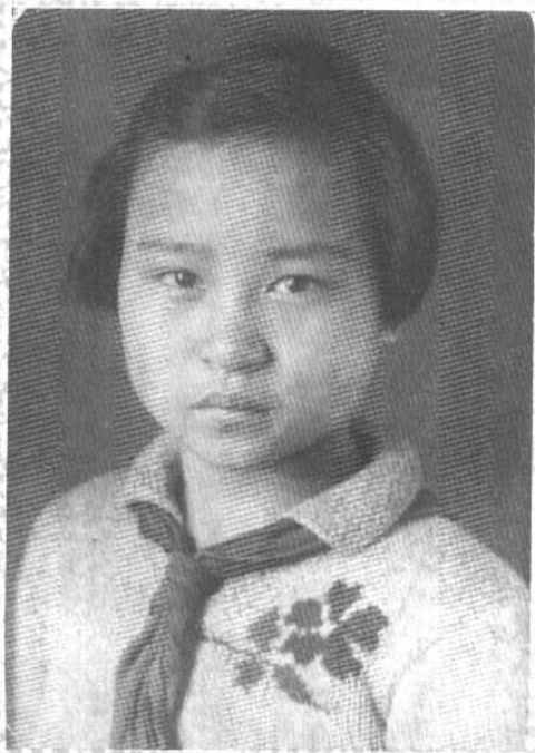
1940年冬于苏联伊万诺沃国际儿童院。