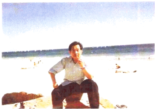
在澳大利亚布里斯本市郊的“黄金海岸”（见书中“梦至欧洲”）。