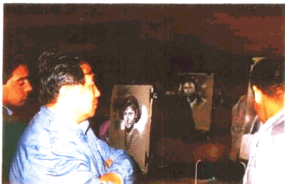
巴黎悉心教学下的艺术佳作，一些获得各异的法国艺术大奖，为生存而给在异国他乡作画，每幅一合天明，于是有了“巴黎夜莺”。