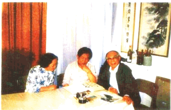
在巴黎著名华人画家靳尚谊家中做客，他在自己的象牙网上雕刻了“马可福音”字句，现被珍藏在北京国大美术馆（见书中“巴黎说解”）。穿花衣者为先生夫人。