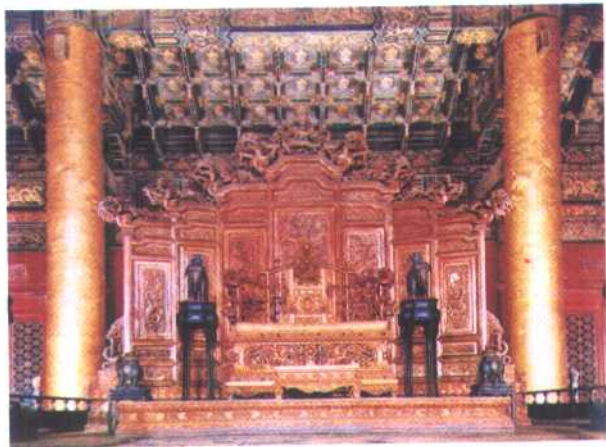
北京故宫太和殿内皇帝宝座