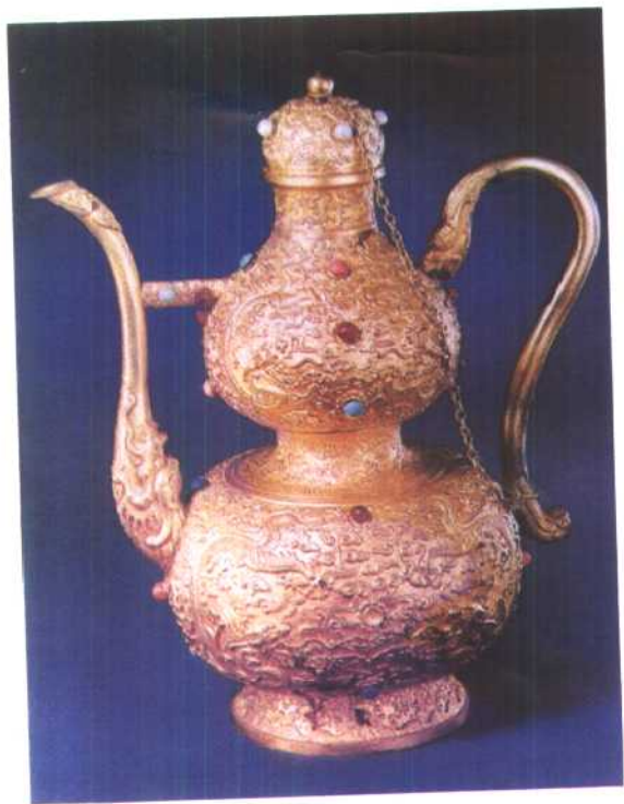
清金鑿龙纹葫芦式执壶（皇帝御用酒器）