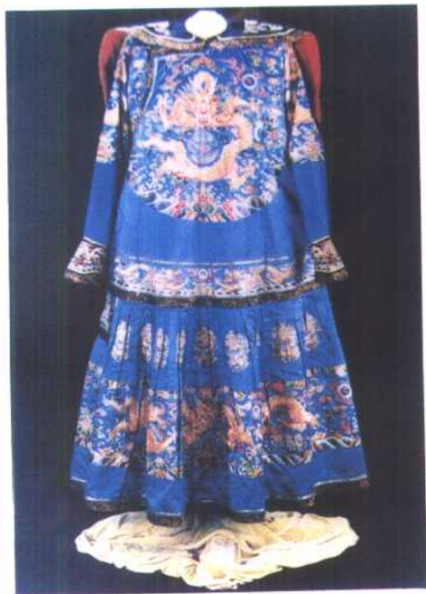
清乾隆皇帝月白缎绣云龙袷朝袍