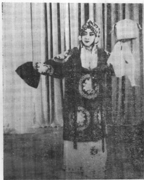
《穆桂英挂帅》中饰穆桂英