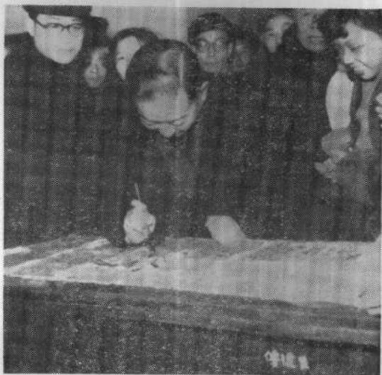
一九五七年在长沙