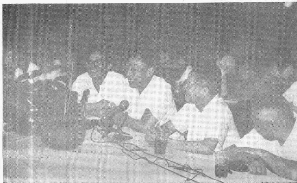
在全国租界史讨论会开幕式上发言