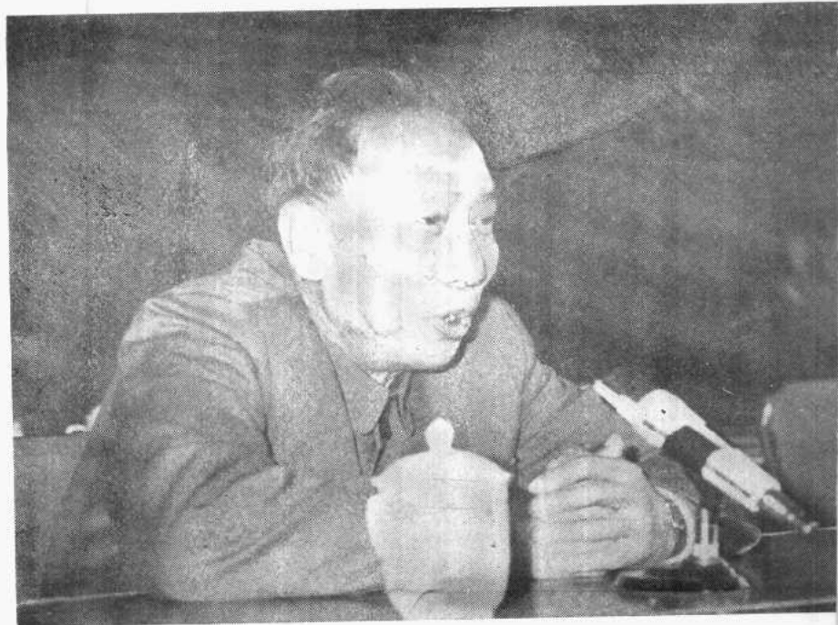
在全国军事史学术讨论会开幕式上发言