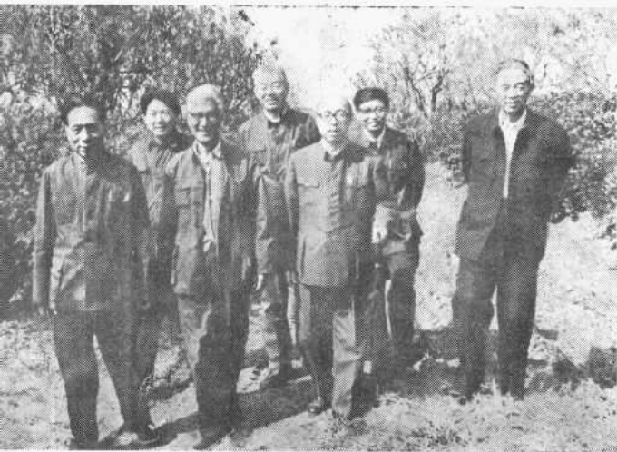
与《中国革命史丛书》 编委在一起。