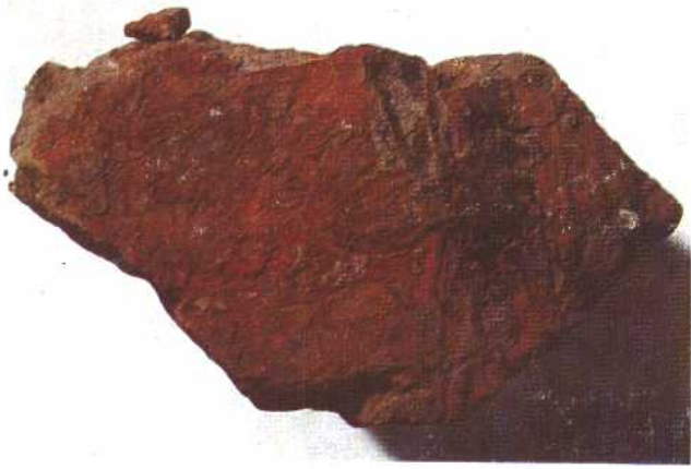
丝织品印痕 西周 1975年陕西宝鸡出土。