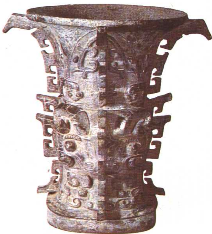
何尊 西周 1963年陕西宝鸡出土。