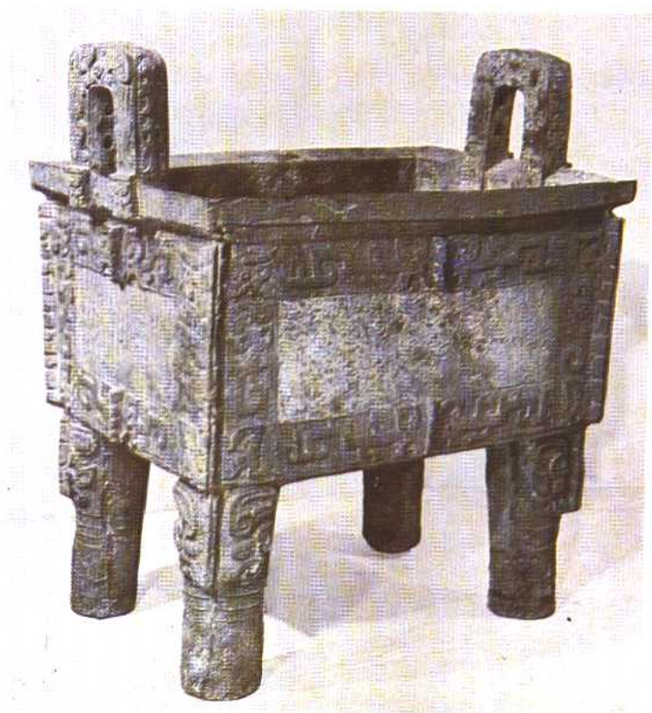
司母戊鼎 商 1939年河南安阳出土。