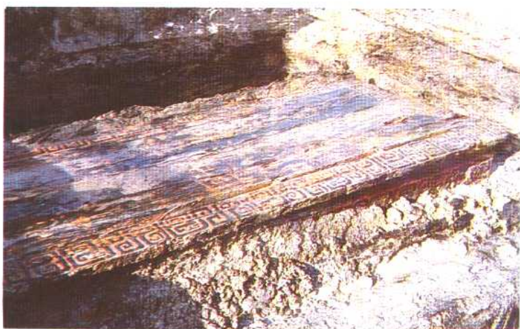
彩桧棺 春秋 1983年河南光山出土。