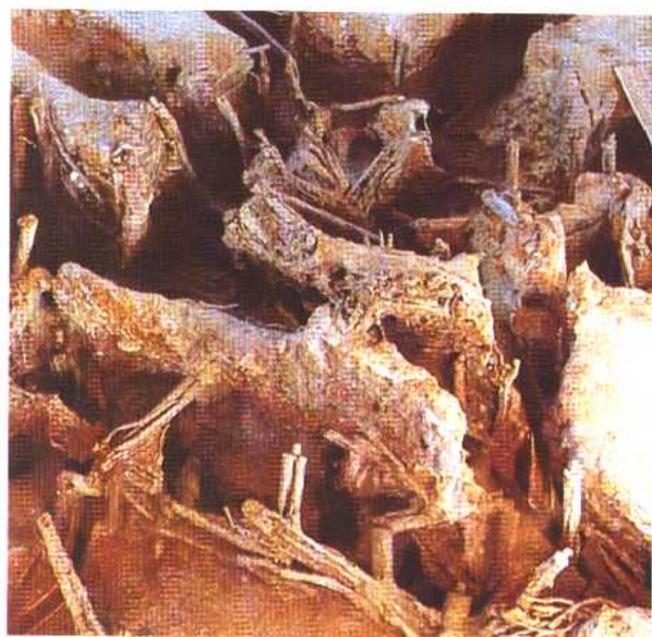
铜矿遗址 春秋 1974年湖北大冶铜绿山发现。