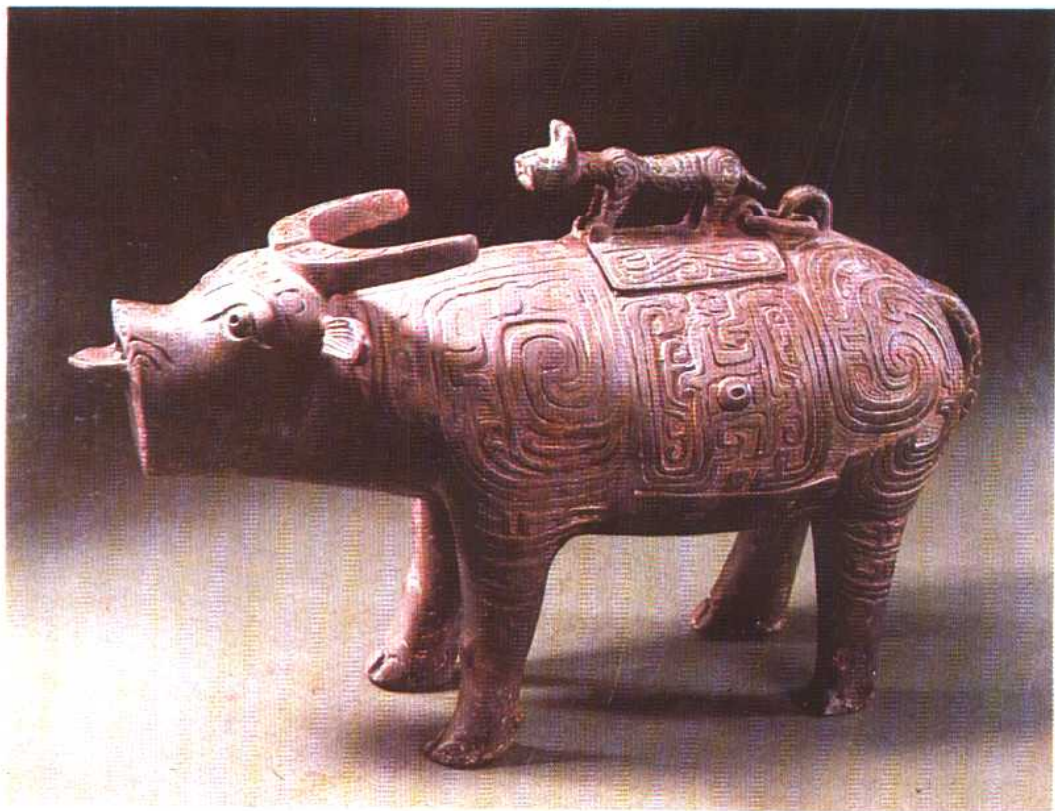
牛尊 西周 1967年陕西岐山出土。