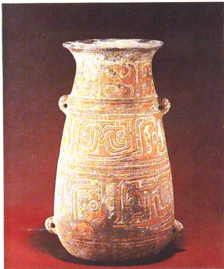
加彩桶形陶罐 夏商时期 1974年内蒙古昭乌达盟出土。