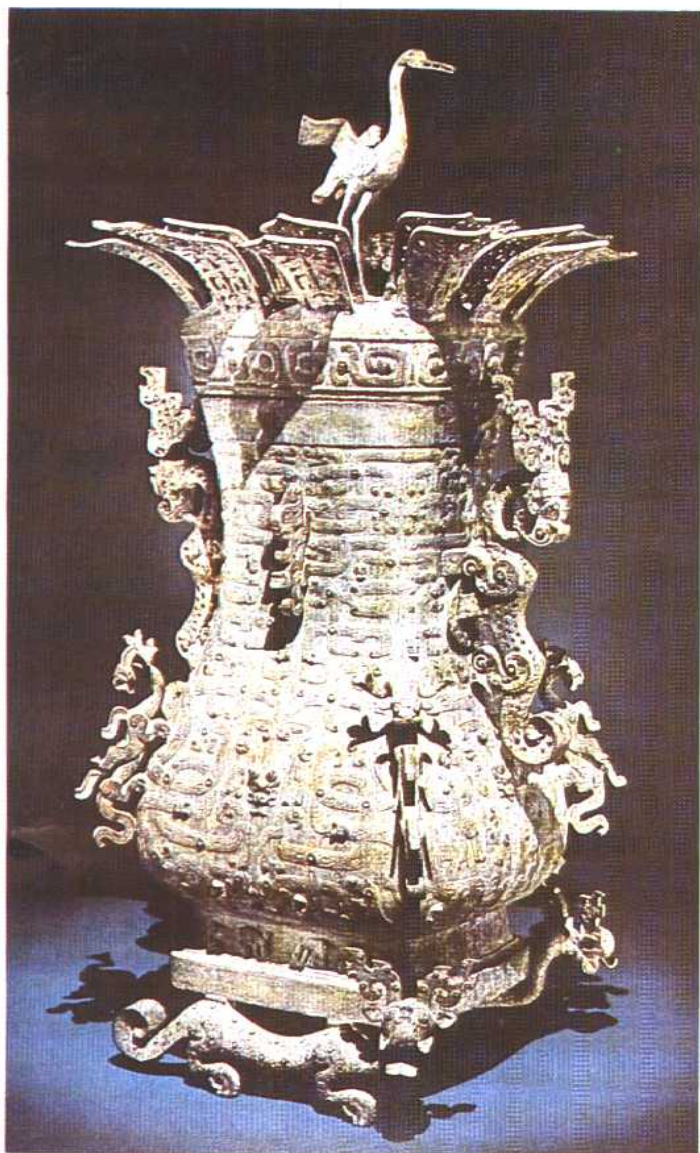
莲鹤方壶 春秋 1923年河南新郑出土。