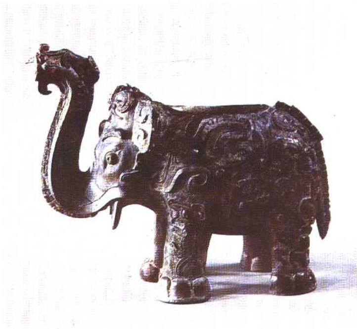
象尊 商 1975年湖南醴陵出土。