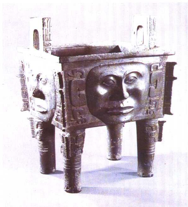
人面纹铜方鼎 商 1959年湖南宁乡出土。