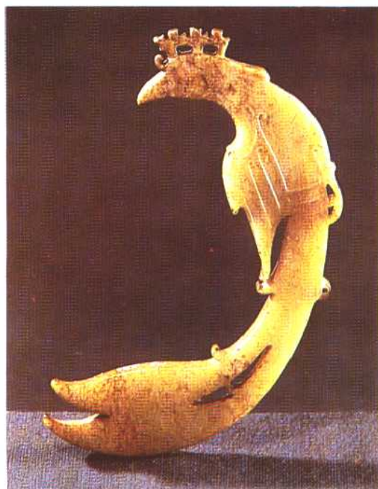
玉凤 商 1976年河南安阳出土。