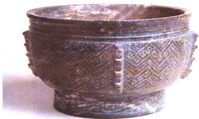
玉簋 商 1976年河南安阳出土。