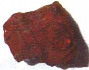
丝织品印痕 西周 1975年陕西宝鸡出土。