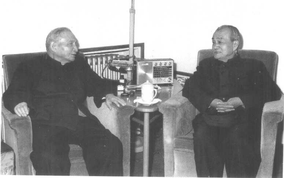
3 1984年1月13日,胡乔木到陈云家中探望