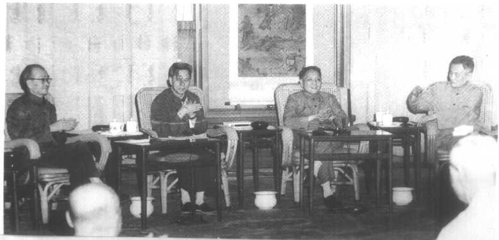
2 1977年8月，胡乔木、方毅、邓小平、程子华（自左至右）在科学教育工作座谈会上