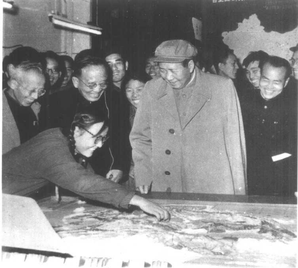
1 1958年10月，胡乔木（右一）随毛泽东参观中国科学院科技成果展览会。 左一竺可桢，左二郭沫若