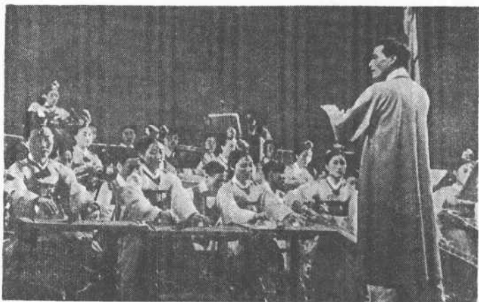
民族艺术剧院演奏古典乐