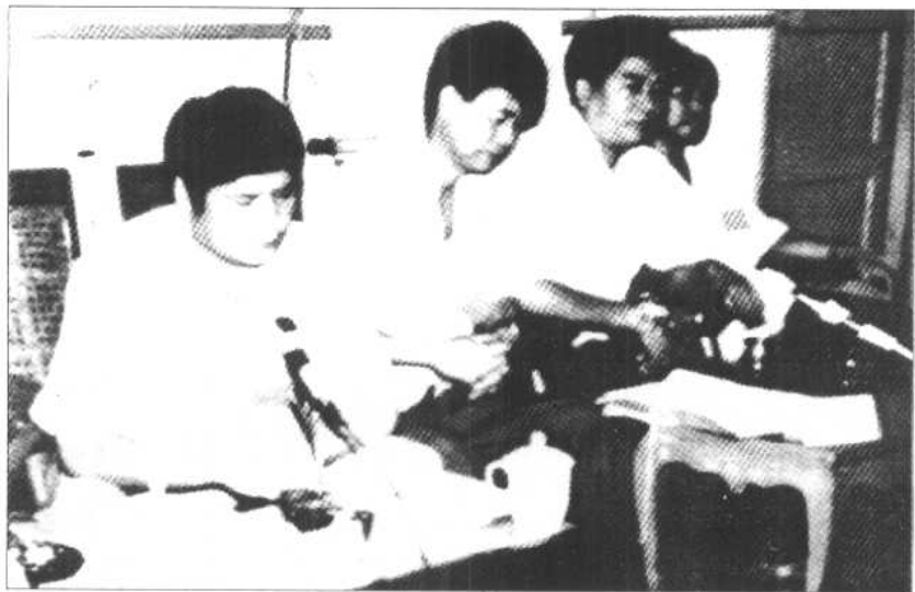
参加学术讨论会的德宏州党政领导： 上图左起：州长管国忠、州委副书记杜培富、州委 宣传部长李向前、州政协副主席多守业。 下图左二：州政协主席叶香瑜。