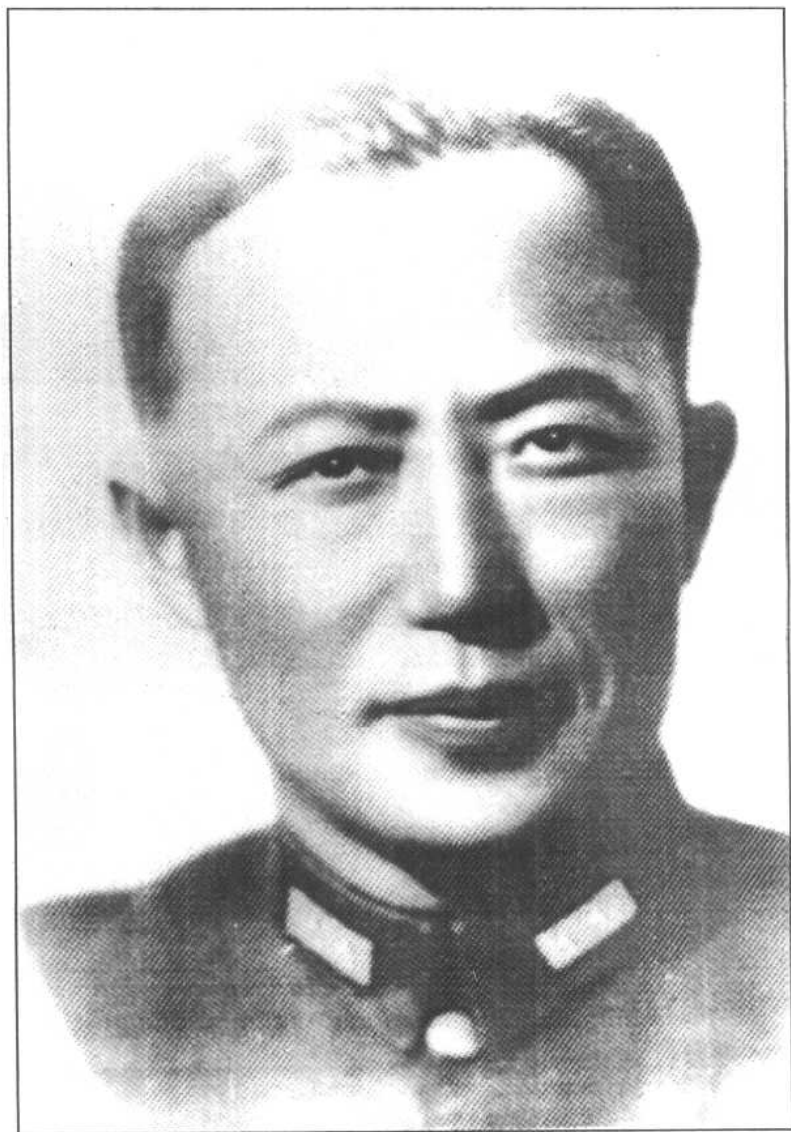
最后攻克松山的远征军第8军副军长李弥。