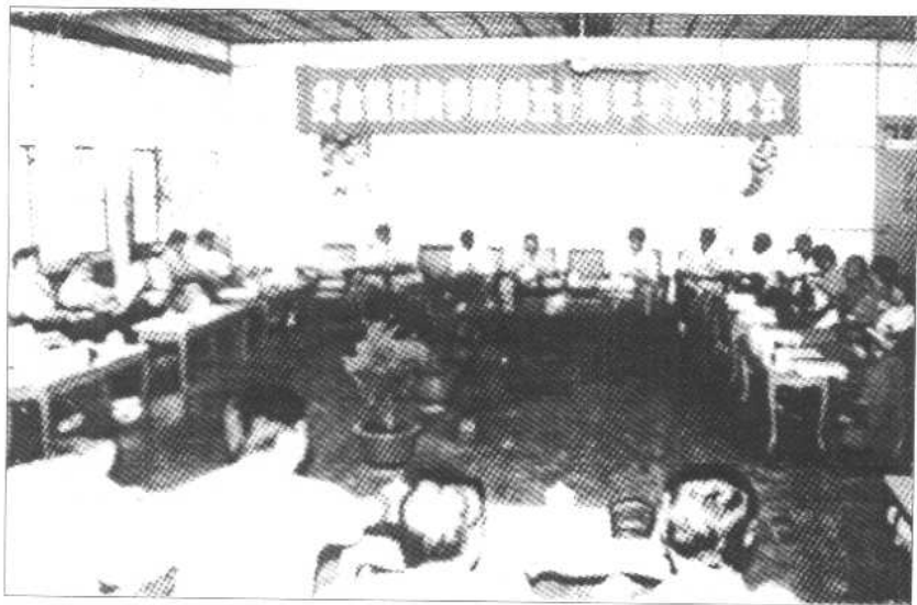
纪念抗战胜利 50 周年学术讨论会会场。