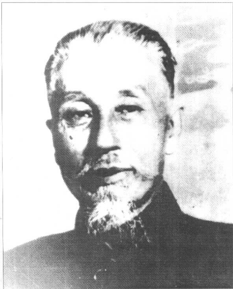
滇西抗日自卫军第一路军司令、干崖土司刀京版。