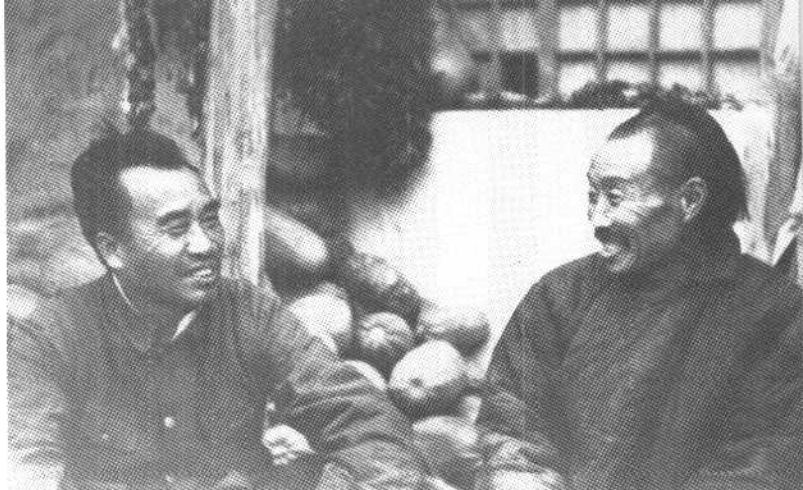
朱德总司令和延安农民亲切交谈（解放战争时期）