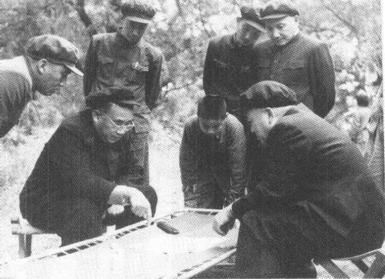
朱德同志和彭德怀同志在北京十三陵下棋， 观棋者（右一）为邓小平同志（一九五三年）