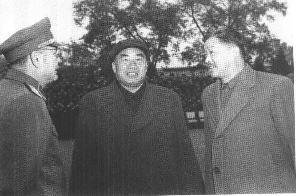
朱德同志和叶剑英、贺龙同志在北京（一九五六年）