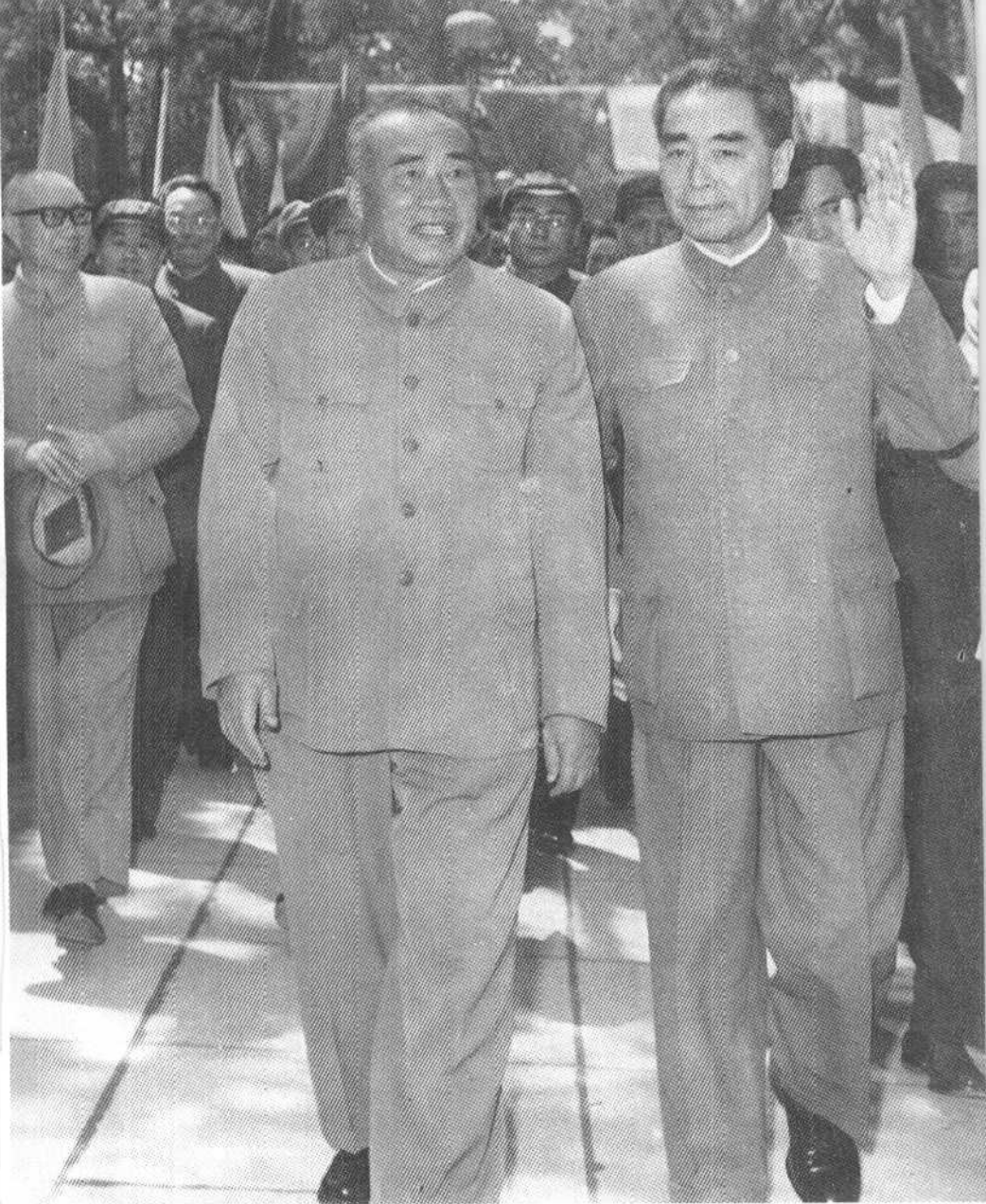
朱德、周恩来同志在劳动人民文化宫和首都群众一起欢渡“五一”节（一九六五年）