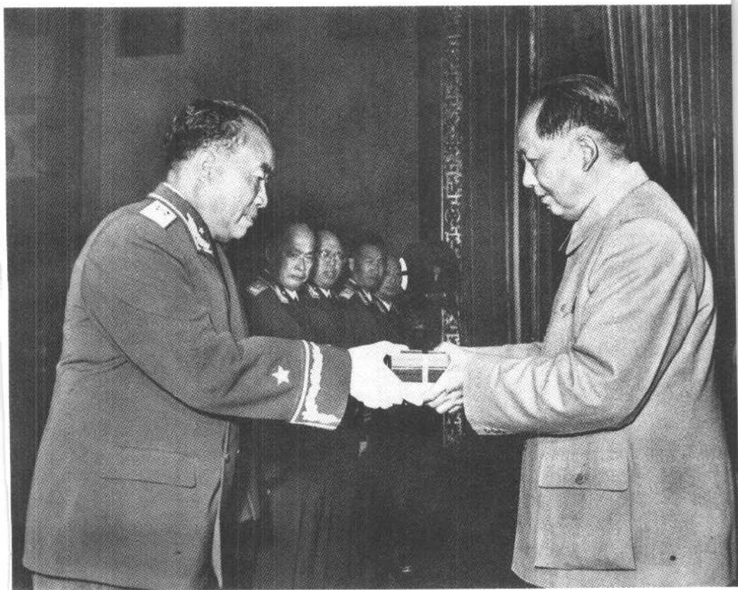
朱德同志接受毛泽东主席授勋（一九五五年）