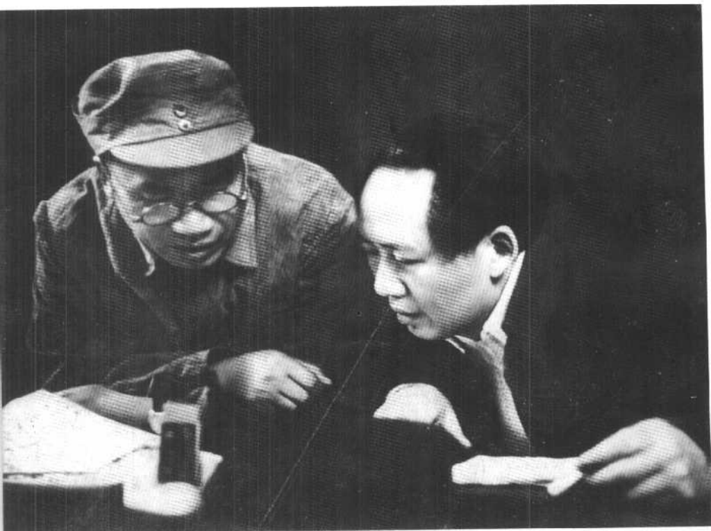
朱德同志和毛泽东同志在党的七大会议上（一九四五年）