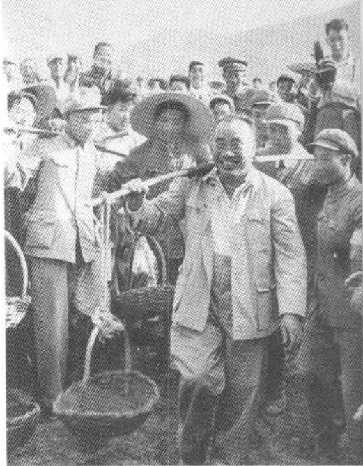
新疆伊犁春花果园的社员们把丰收 的水果送给朱德同志（一九五八年）