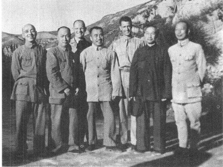
朱德、陈毅、吴玉章、 杨尚昆、聂荣臻同志 和美军观察组成员 谢伟思(后右)、惠特 尔赛(后左)在延安 合影(一九四四年)