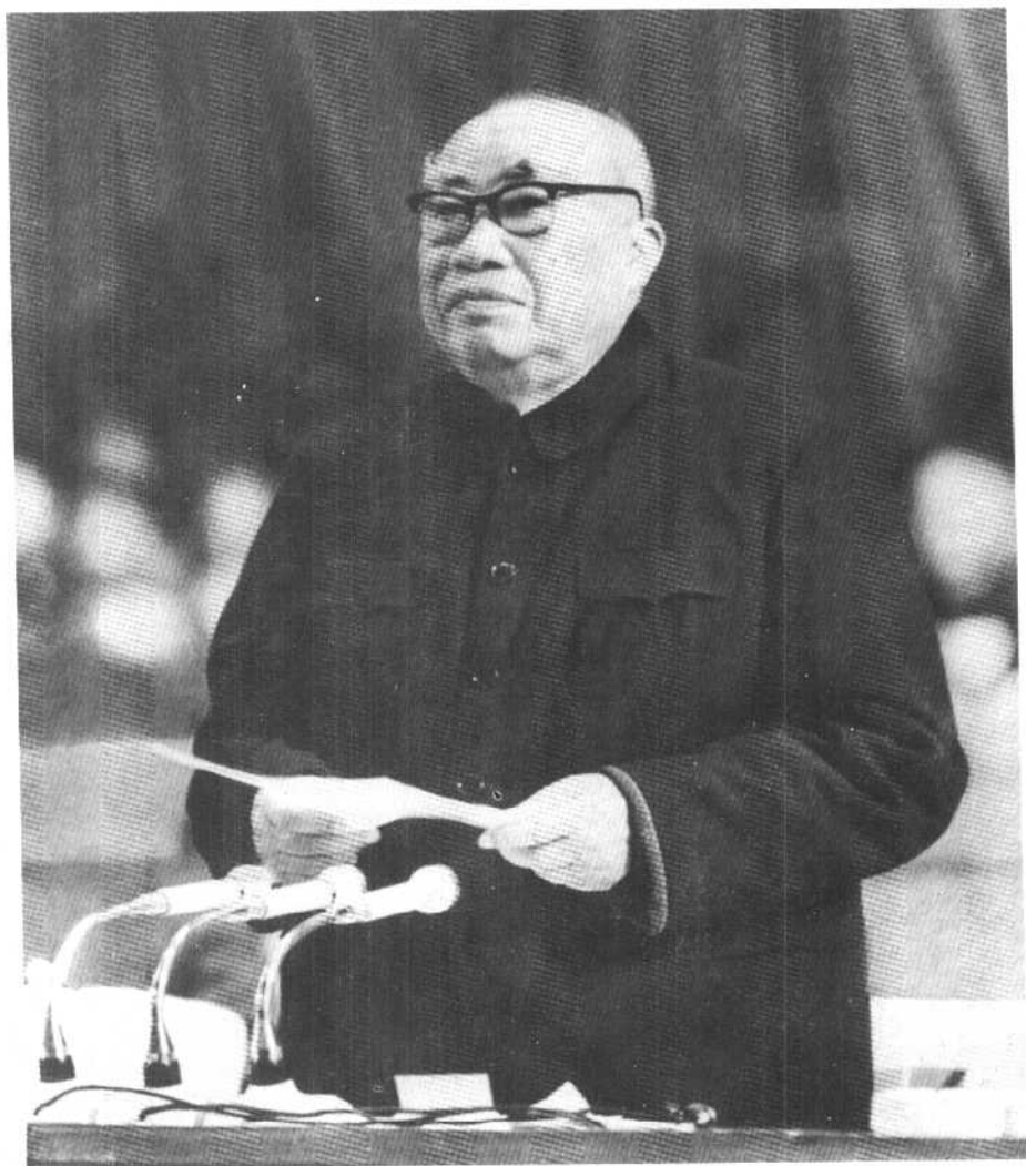
朱德委员长主持第四届全国人民代表大会第一次会议（一九七五年）