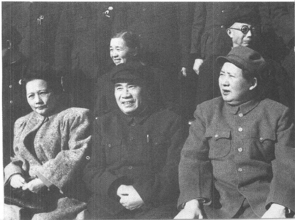
朱德总司令和毛主席、宋庆龄副主席一起 接见政协一届三次会议代表（一九五一年）