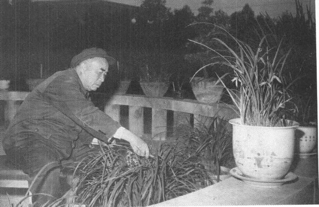
朱德同志在成都（一九六一年）