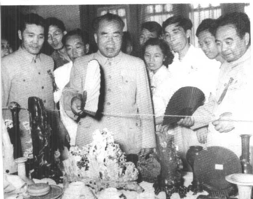
朱德副主席在全国工艺美术艺人代表会议上（一九五七年）