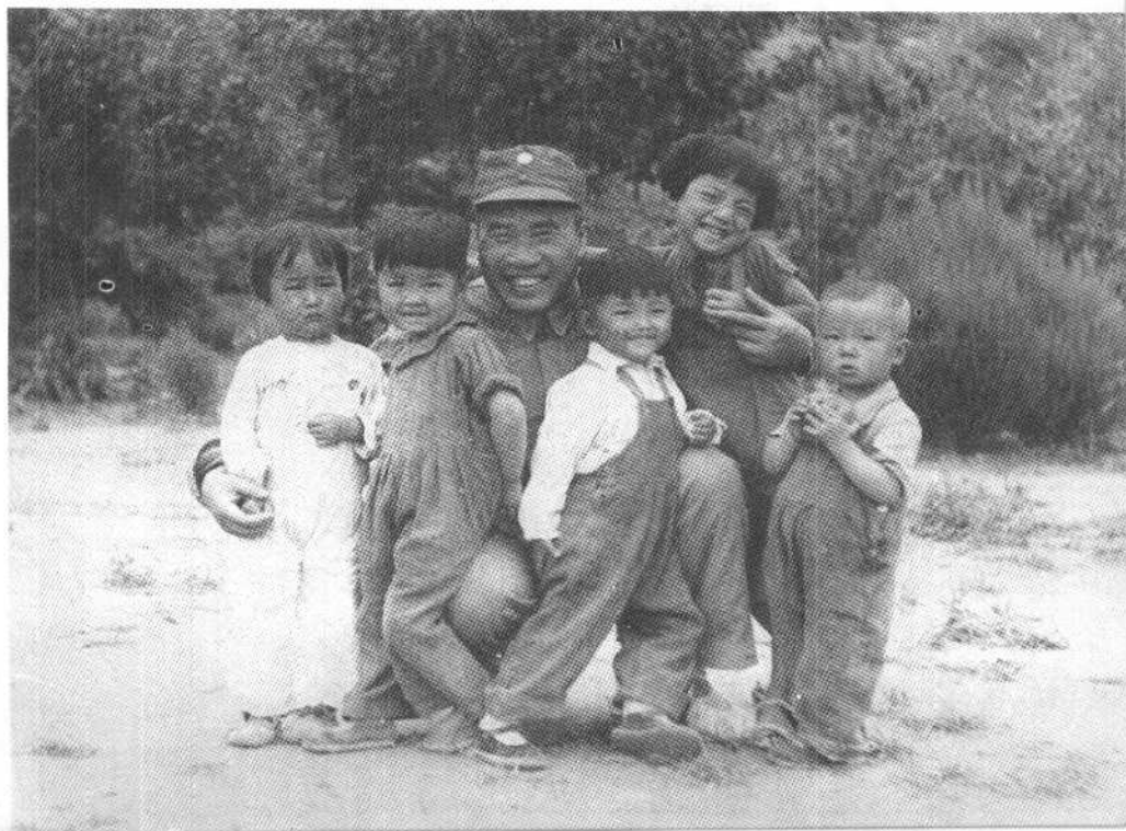
朱德总司令在延安王家坪和孩子们在一起(一九四四年)