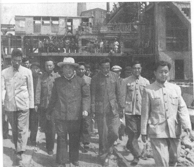
朱德同志视察 石景山钢铁厂 三号炼焦炉 （一九五九年）