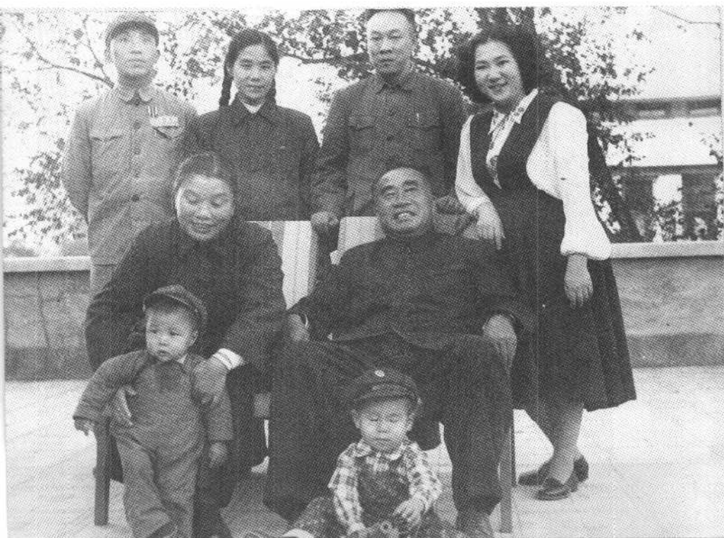
朱德同志全家在北京（一九五三年）