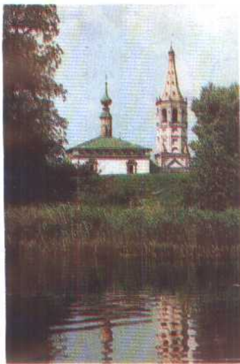
5. 莫斯科新处女修道院