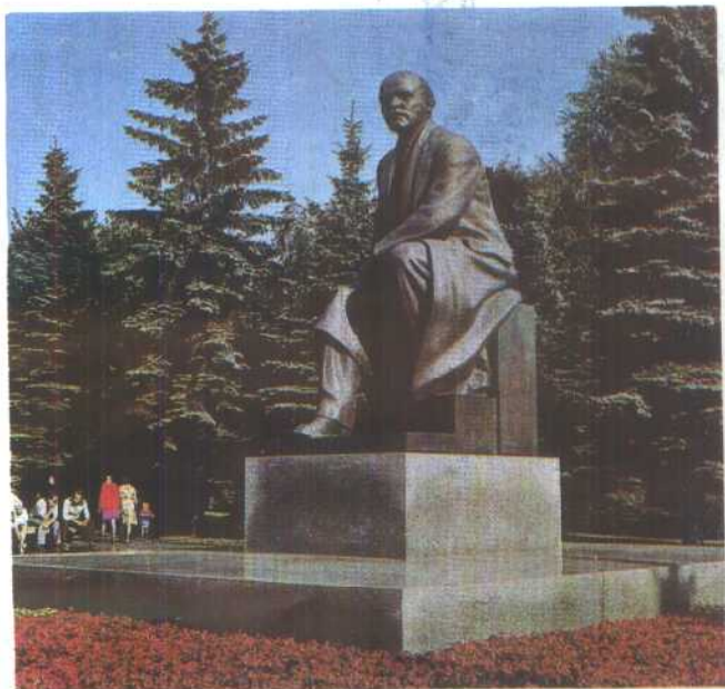
1. 克里姆林宫中的列宁雕像