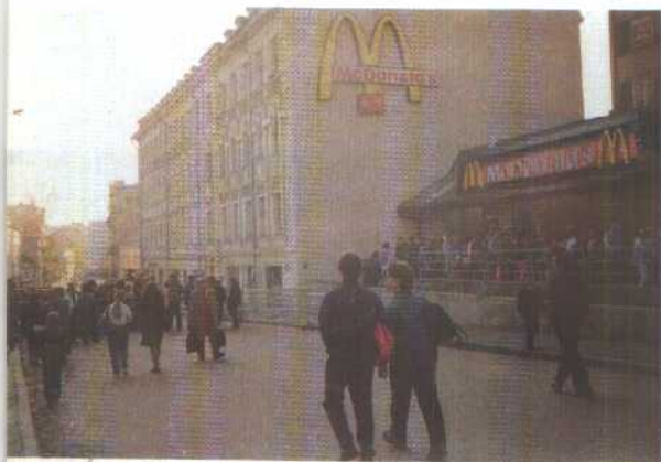
8. “麦克唐纳” 快餐店门口 排成长龙