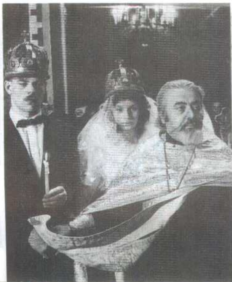
2. 俄罗斯青年在教堂里结婚