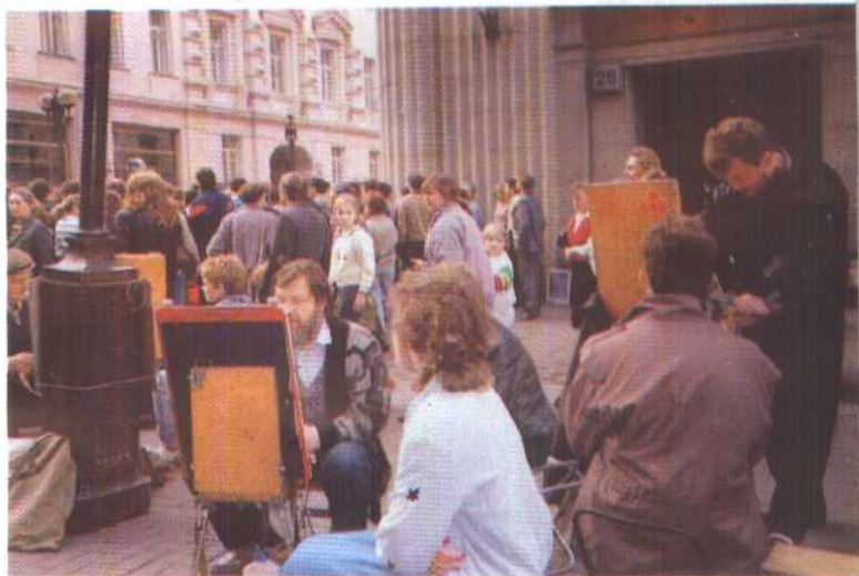
6. 在阿尔巴特街区，街头艺人的生意很红火