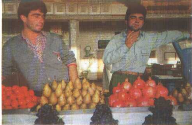
7. 莫斯科个体户的摊位上东西还是不少的