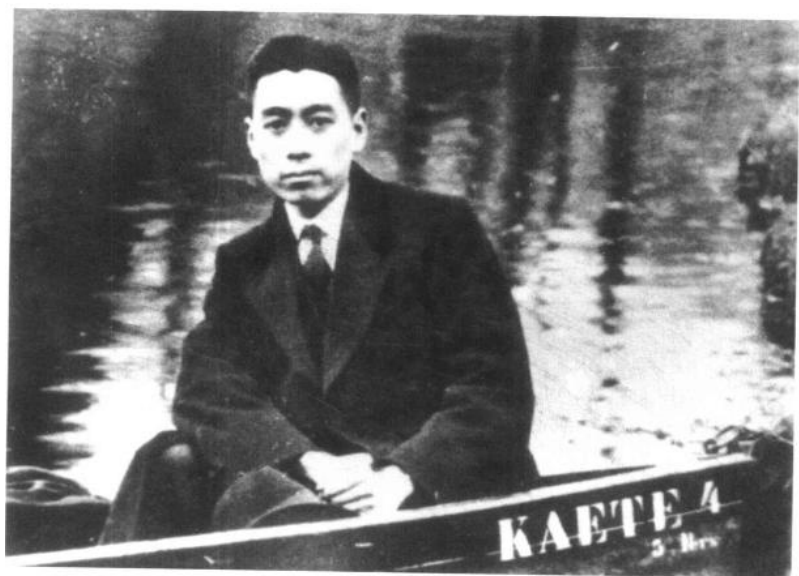
1920年11月7日， 周恩来赴欧俭学。图 为旅欧时期的周恩来。