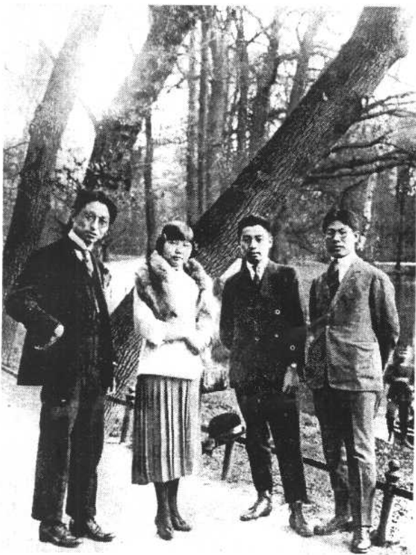
1922年，周恩来 与张中府(左一)、刘 清扬(左二)、赵光宸 (右一)合影。

1922年，周恩来 为购买德文《经济学 原理》和订阅英文 《每日先驱报》致留 英南开同学常策欧 (醒亚)明信片手迹。