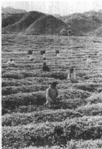
江西婺源县1986年 出口茶叶3 750吨

1. 联产承包制使农民取得了充分的自主权，成为自负盈亏的商品生产者和经营者。这为农村商品经济的发展创造了最重要的前提，也是随后一系列振奋人心的变化的生长点。农村原来就没有“铁饭碗”，经过改革又彻底取消了“大锅饭”，分散经营的承包农户比城市国营企业自主权更大，可以按价值规律办事，按市场需求组织生产。但是，农民没有搞商品生产的经验，一家一户分散经营，没有中间