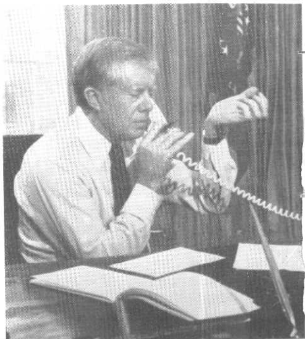
卸任前的紧张时刻 →