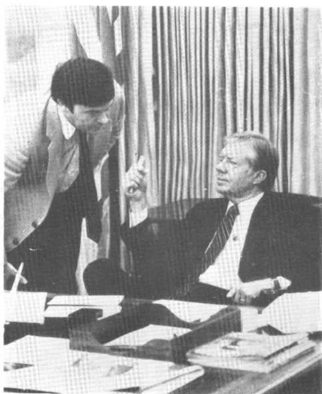
本书作者吉米·卡特