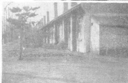
当年的特别 监狱外景