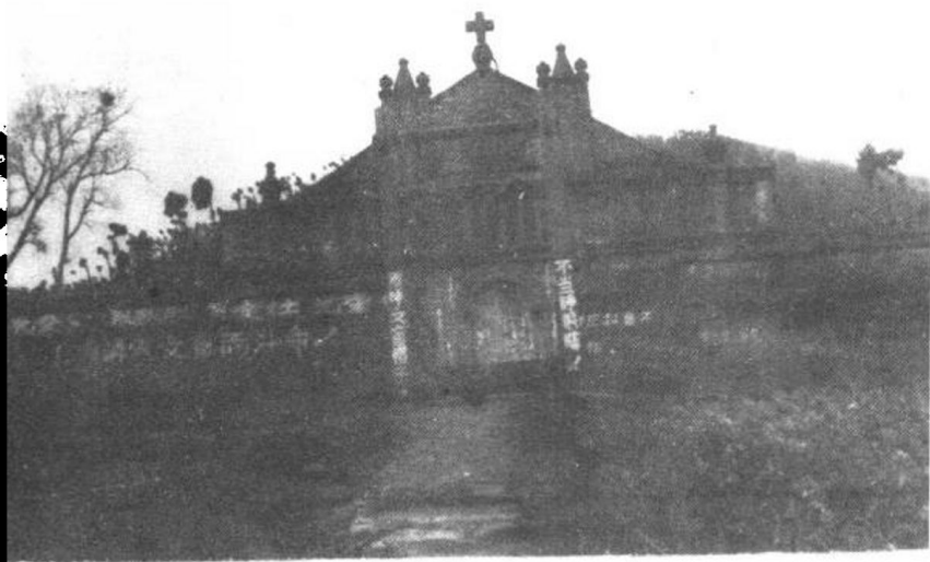
金堂县苏家壩天主堂