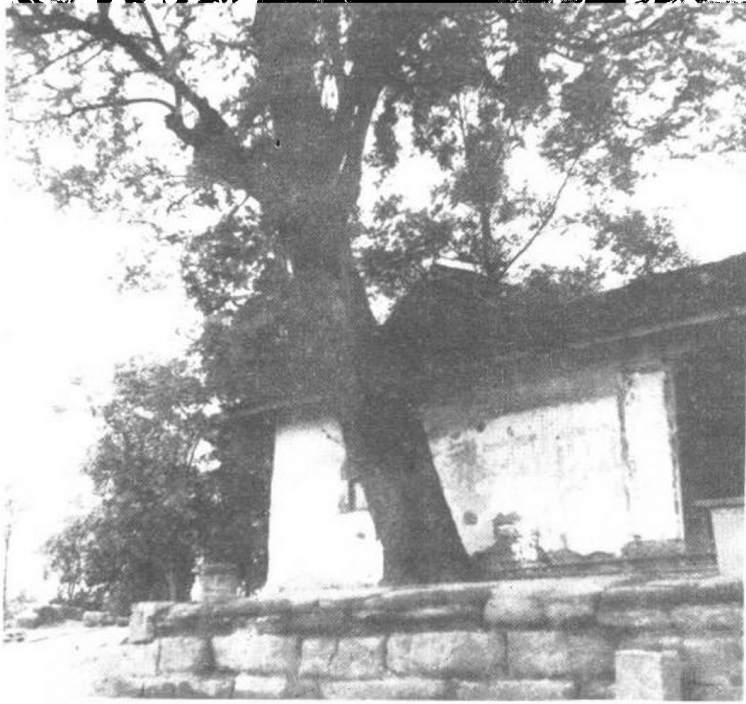
金堂县火盆山火盆寺一角 一九〇二年廖 观音、唐顺之率领义和团与清军激战于此。