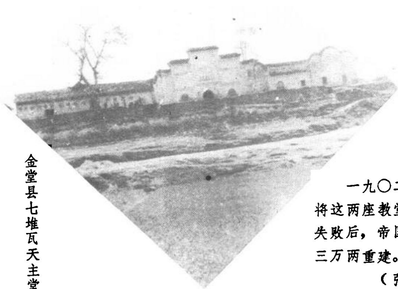
金堂县七堆瓦天主堂

一九〇二年四川义和团 将这两座教堂捣毁。起义军 失败后，帝国主义勒索赔款 三万两重建。