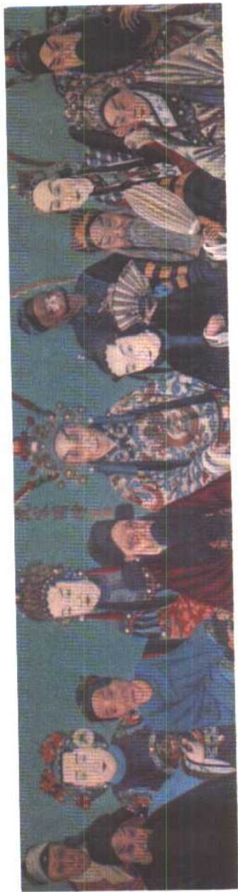
图1 “同光京剧十三绝”画像