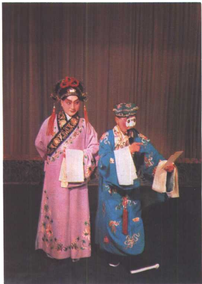
图12 《群英会》“蒋干盗书”