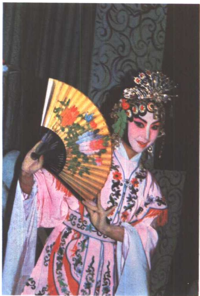
图 11 《包龙图陈州私访》