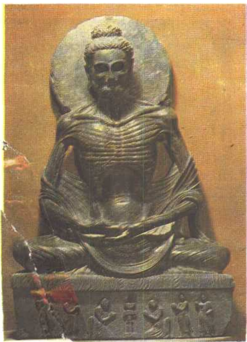
石雕释迦牟尼禅定像 （在巴基斯坦白沙瓦博物馆）