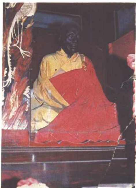
六祖慧能真身 (在 广东韶关市马坝南华寺 即唐之韶州曹溪宝林寺)