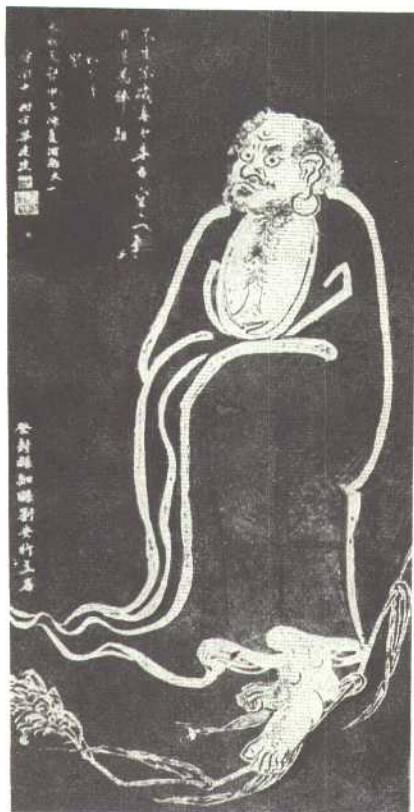
石刻菩提达磨像 (在西安碑林)