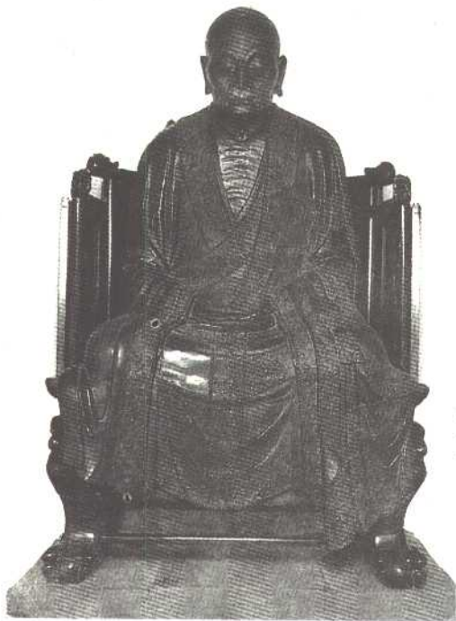
六祖慧能铜像 (北宋初铸，在广州 六榕寺)