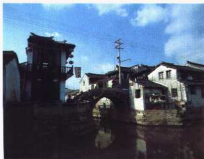
江南第一水乡-周庄