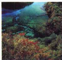
四川九寨沟五花海