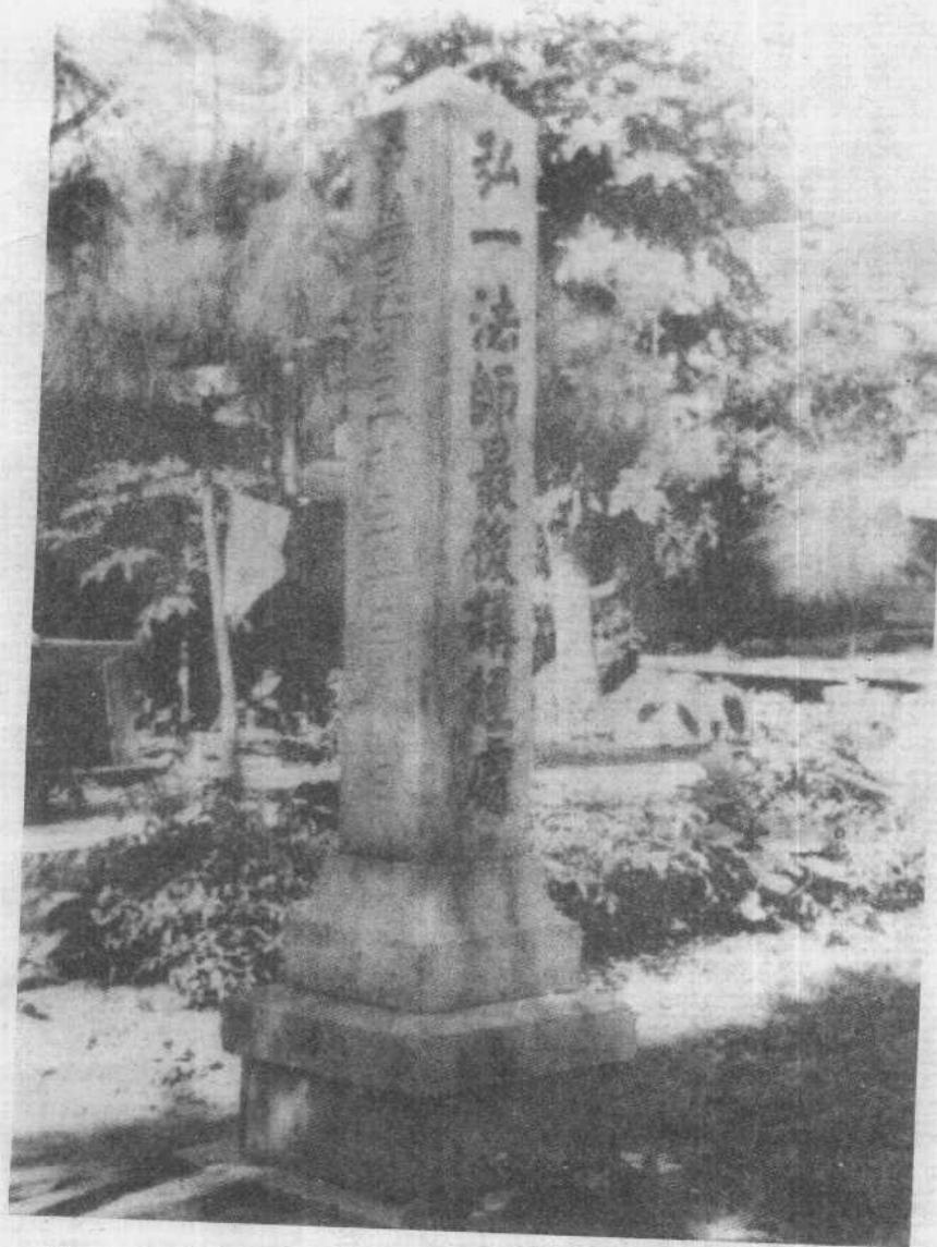
弘一大师最后讲经处纪念碑（福建）