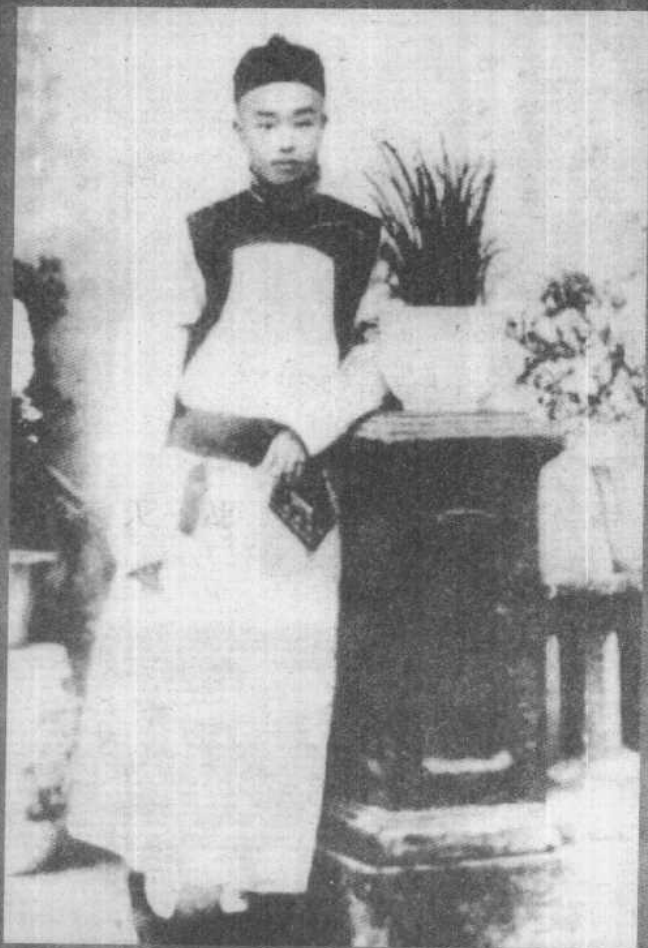
李叔同 1900 年在上海（脫去外衣照）