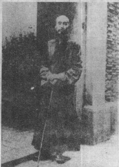
弘一大師 1932 年在上海