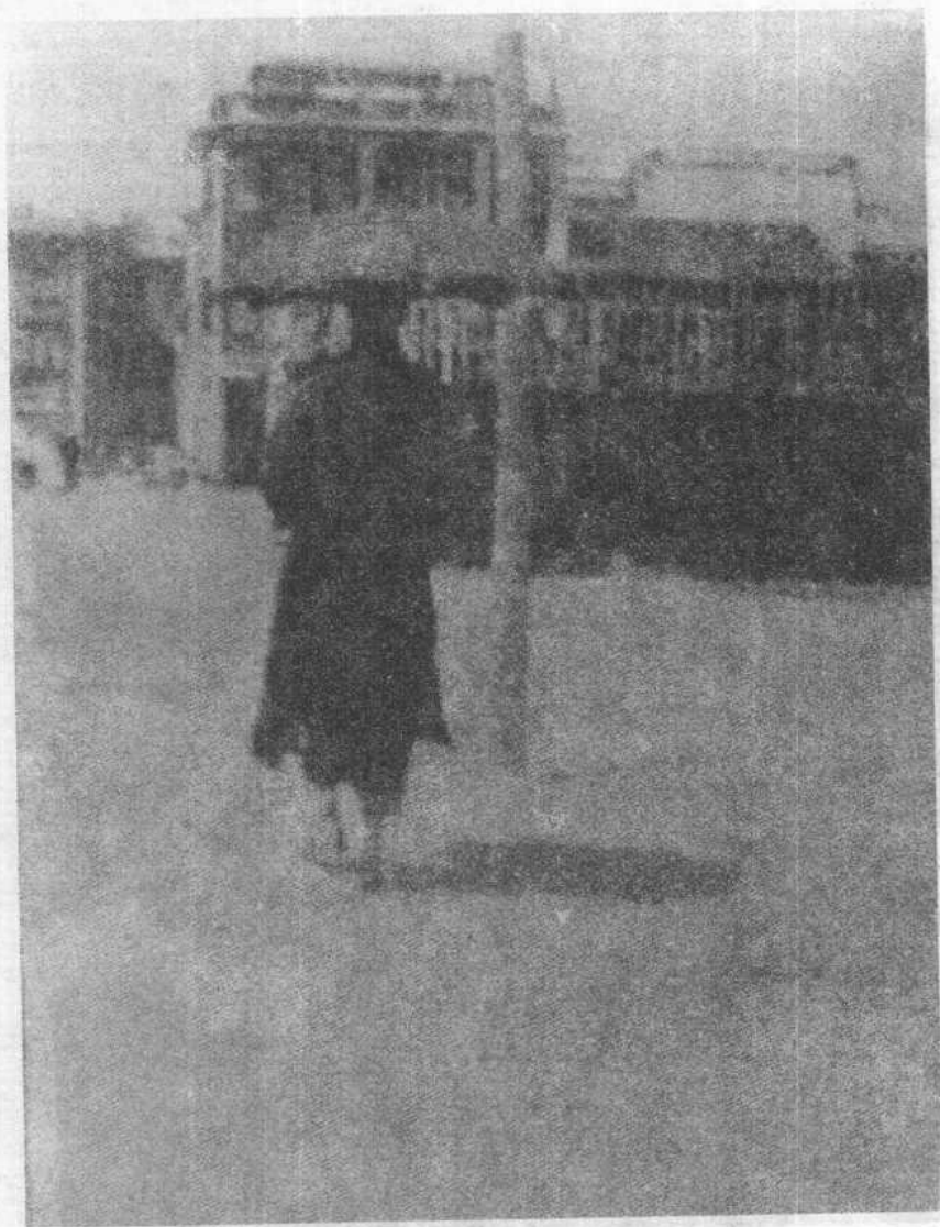
弘一大师潇洒的背影