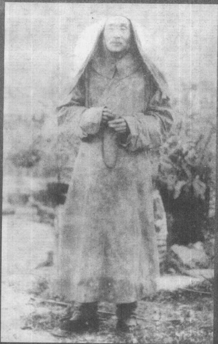
晚年弘一大师的道影