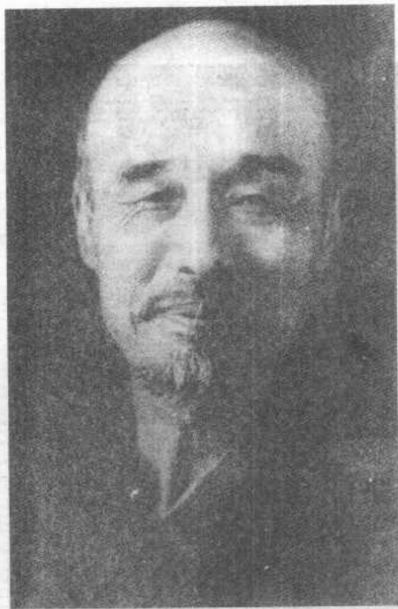
弘一大师像（1937年摄于上海）