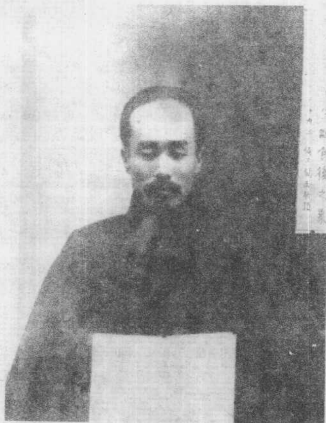
李叔同于 1916 年冬断食后留影(杭州)