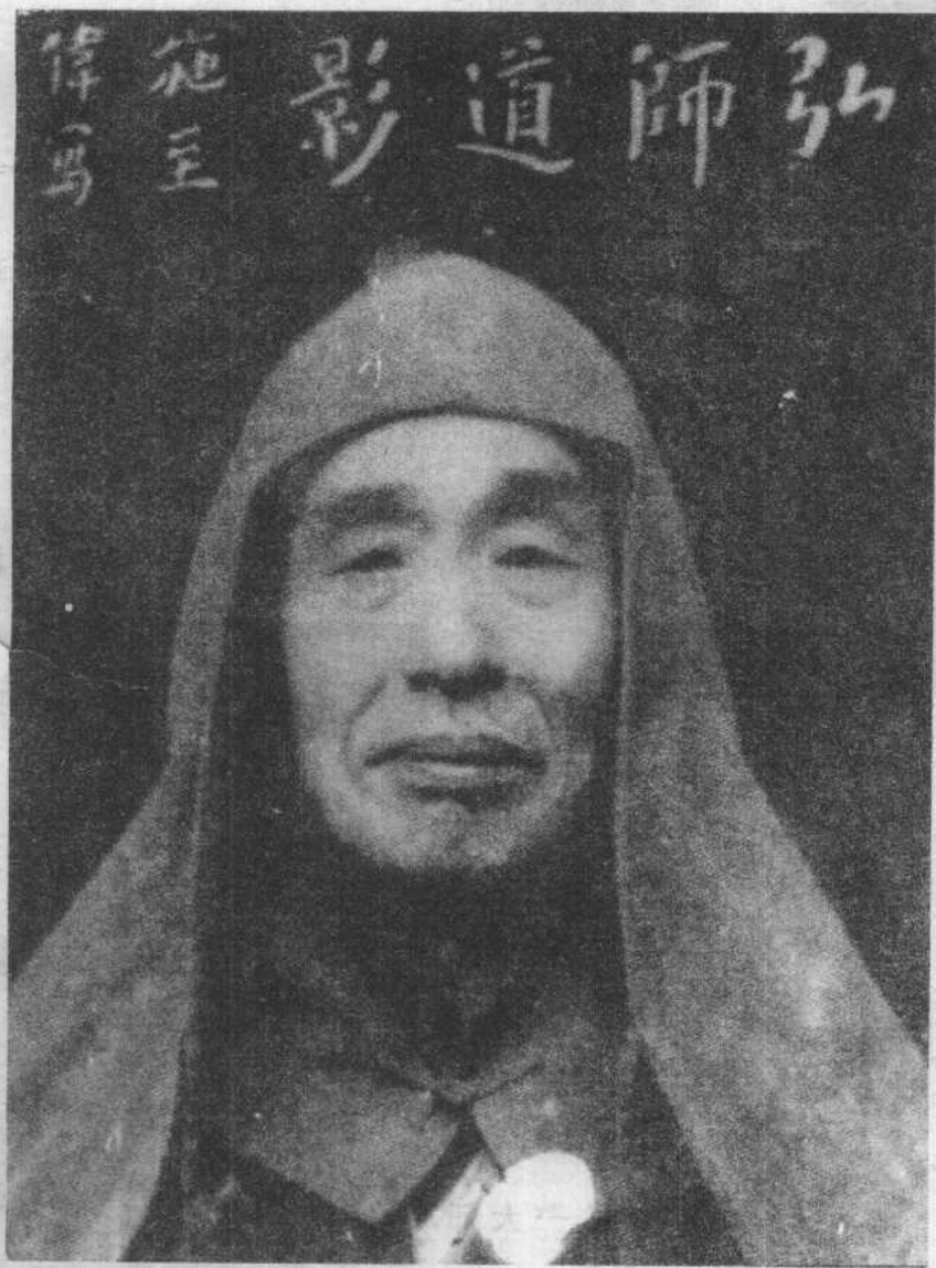
弘一大師道影（1941年攝于晉江）