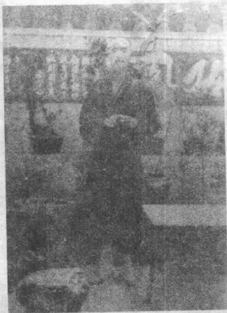
弘一大师在漳州梅园