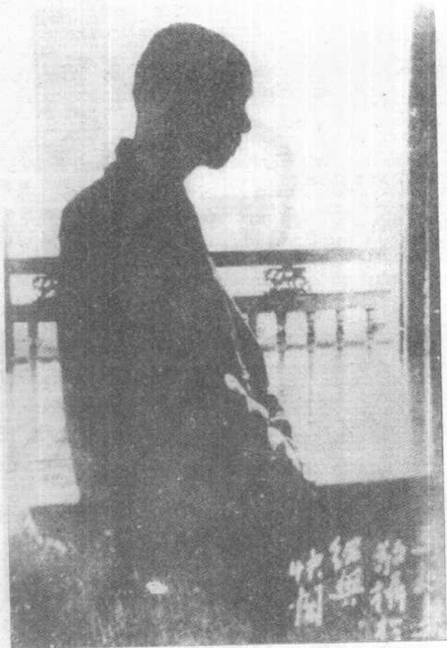
弘一大师绍兴留影（1931年摄于绍兴）