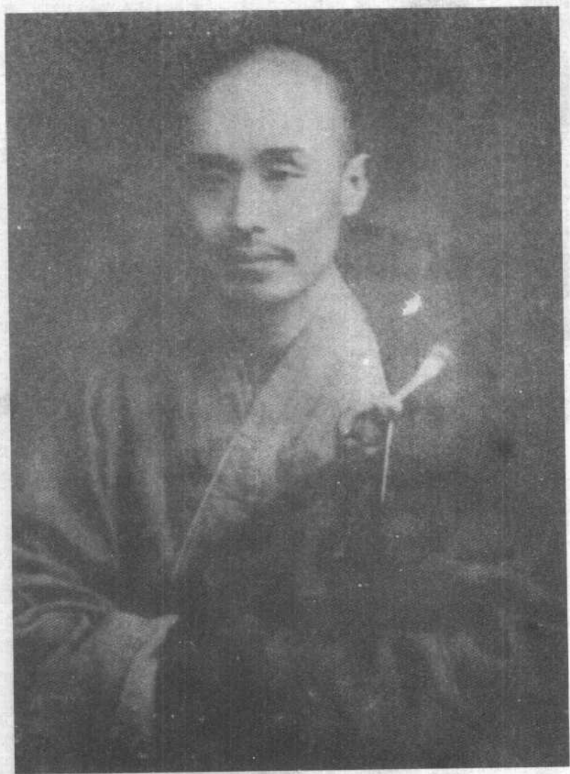
弘一大师僧装像（1920年摄于杭州）