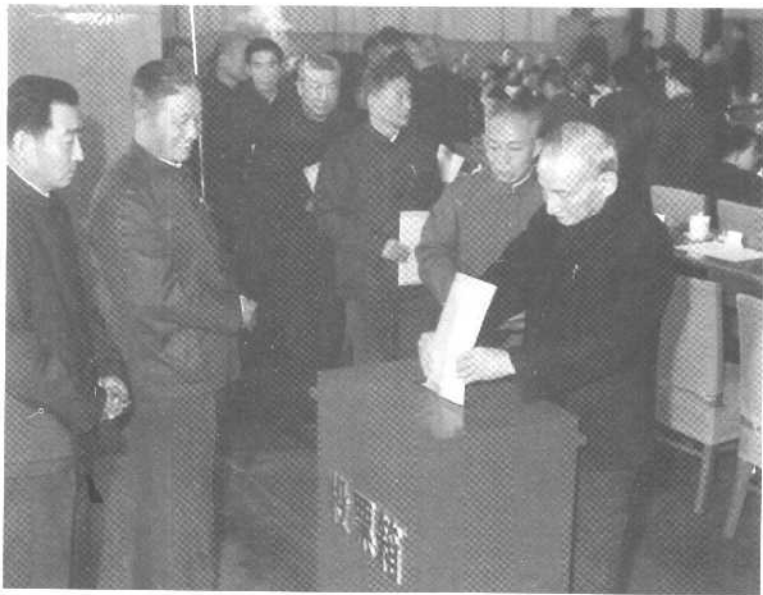
陈云等同志在1978年12月22日中共十一届三中全会闭幕会上投票。