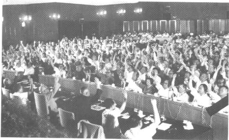
1981年6月，中共十一届六中全会通过《关于建国以来党的若干历史问题的决议》。