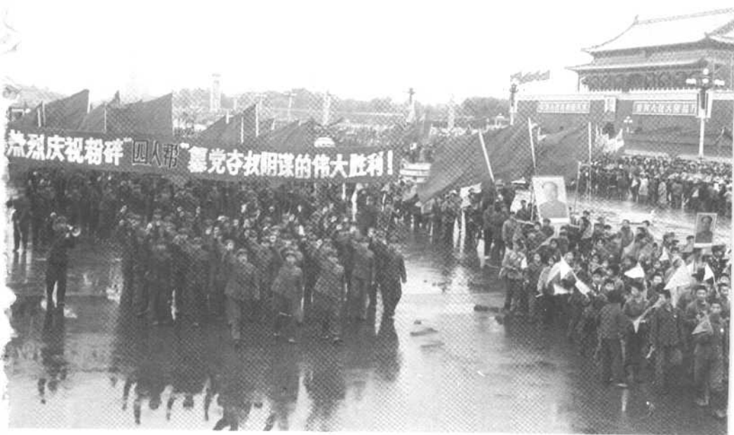
1976年10月24日，首都百万军民在天安门广场集会游行，庆祝粉碎“四人帮”的伟大胜利。