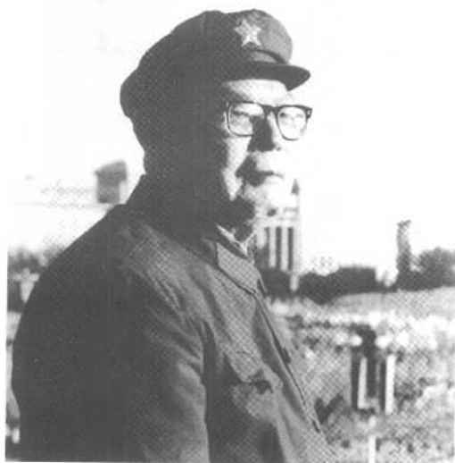
叶剑英在 天安门庆祝大 会上。