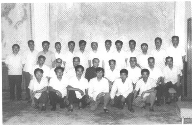
1981年6月，胡耀邦、胡乔木、邓力群等同志与《关于建国以来党的若干历史问题的决议》起草组成员和工作人员合影。