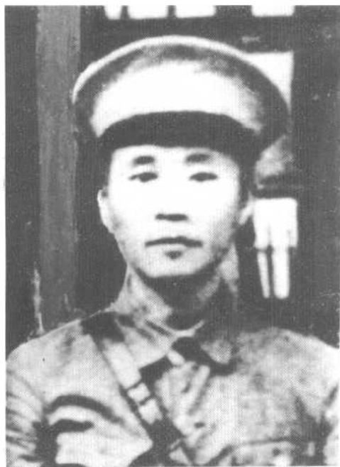
卢 德 铭