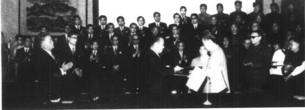
1972年9月，周总理和田中角荣总理大臣在北京签署《中日联合声明》，中日建立外交关系。