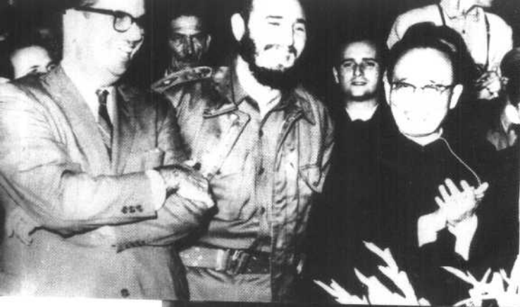
1960年12月，郭沫若副委员长率代表团访问古巴，同多尔蒂科斯总统、卡斯特罗总理（中）在一起。