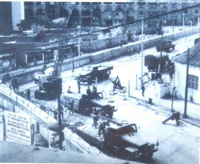
根据华约国建议，民主德国作出加强 边界管理的规定，于1961年8月13日封 锁东、西柏林之间的边界，从8月15日 起，在东、西柏林分界线上修筑柏林墙。