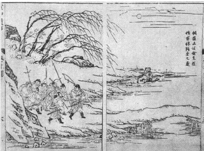
《大宋宣和 遗事》 明崇祯间 (约 1635 年) 刻本