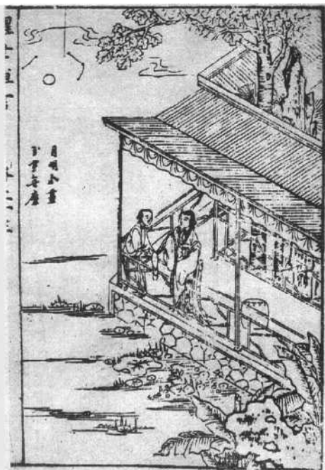
《醒世恒言》明天启 七年(1627年)刻本