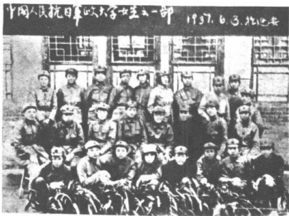
1937年6月， “抗大”二期的女生 区队一部分学员 合影。