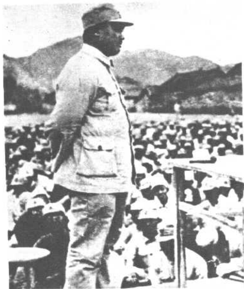
贺龙在“抗大”作报告。