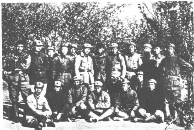
1937年4月， 朱德（前左4）、罗 瑞卿（前左3）、罗 荣桓（后左7）与 “红大”一期留延安 的部分学员合影。