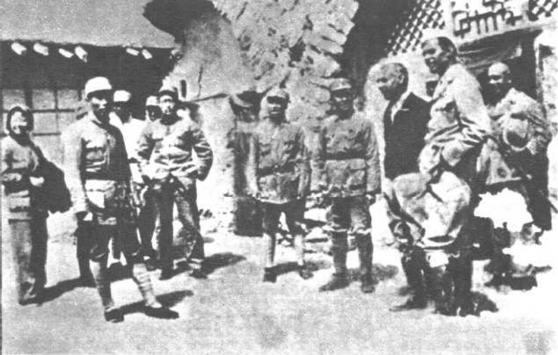
印度援华医疗队参观“抗大”。