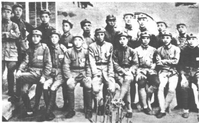
欢送“抗大” 毕业同学到晋察冀 抗日根据地。