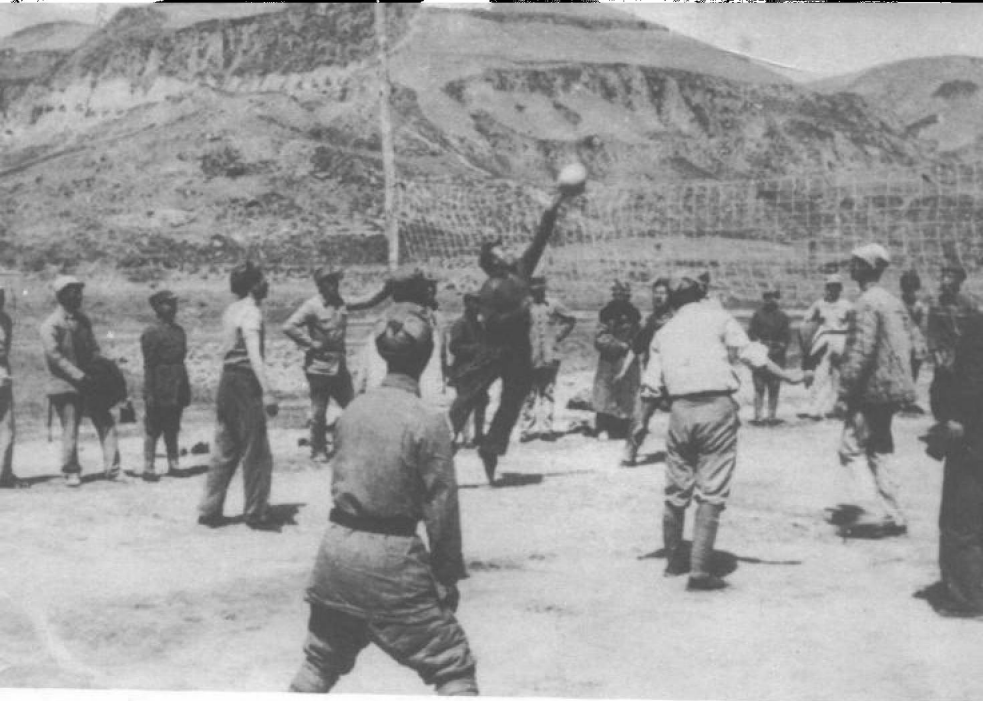
朱德和“抗大”学员打排球。