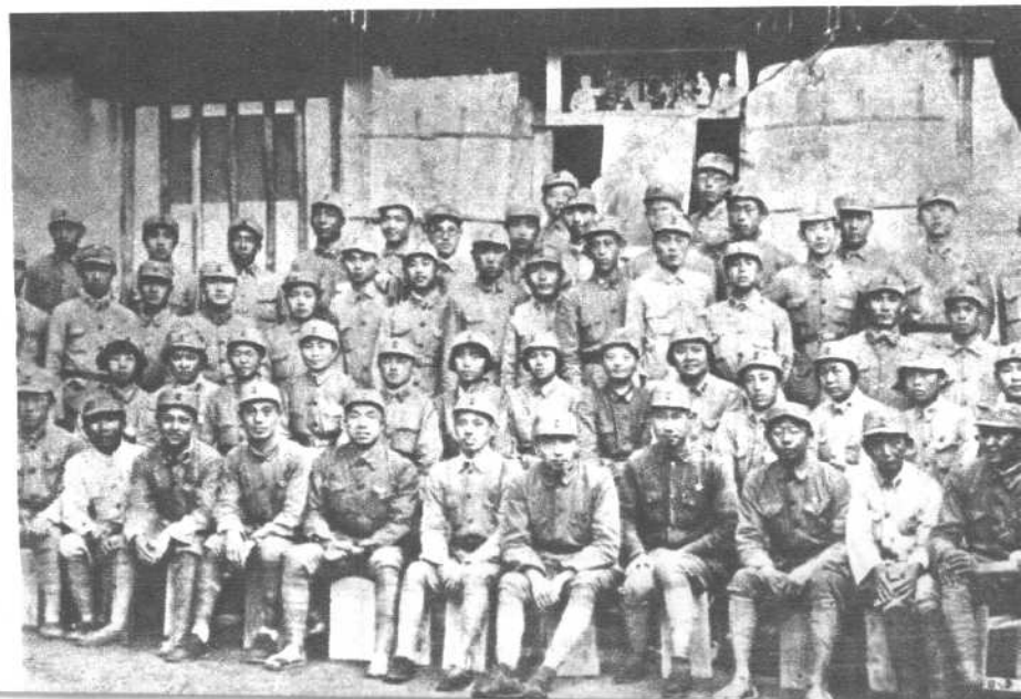
“抗大”政治工作训练班开学合影。