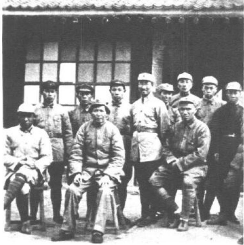
1937年，毛泽东、朱德等在延安与“红大”学员合影。

月20日，在“红大”第二期开学之际，将校名改为“中国人民抗日军政大学”，校址由保安迁至延安。从此，“抗大”这面光辉的旗帜，高高飘扬在庄严古老的延安城。