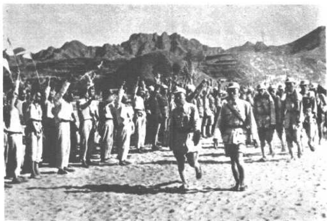
1937年6月， “抗大”欢送首批 学员参加江南游击 队时合影。