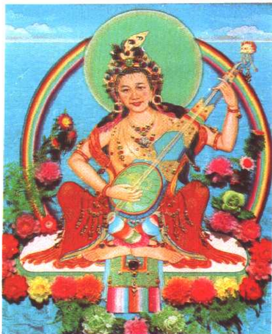
拉卜楞寺绘画——妙音天女