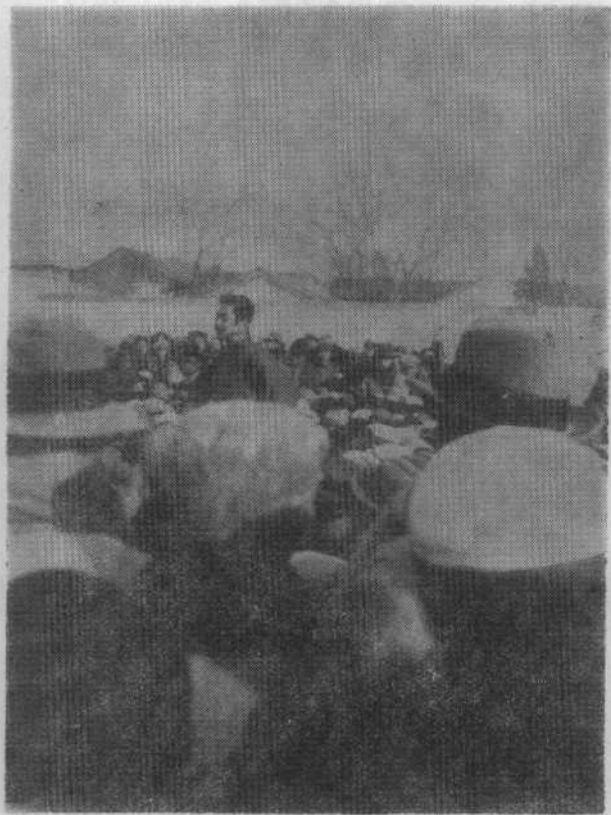
1932年11月27日摄于北京师范大学操场