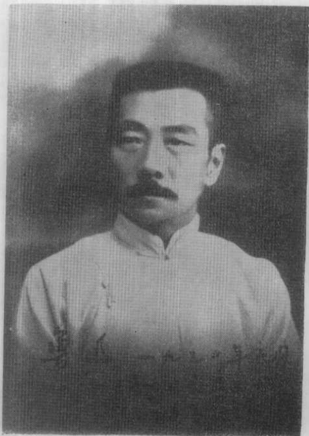
魯 迅 像