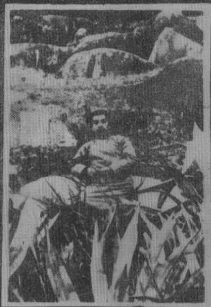
1927年1月2日摄于厦门南普陀