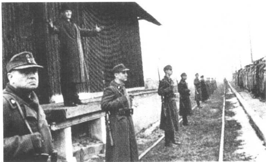
投机商兼纳粹党员辛德勒出场。