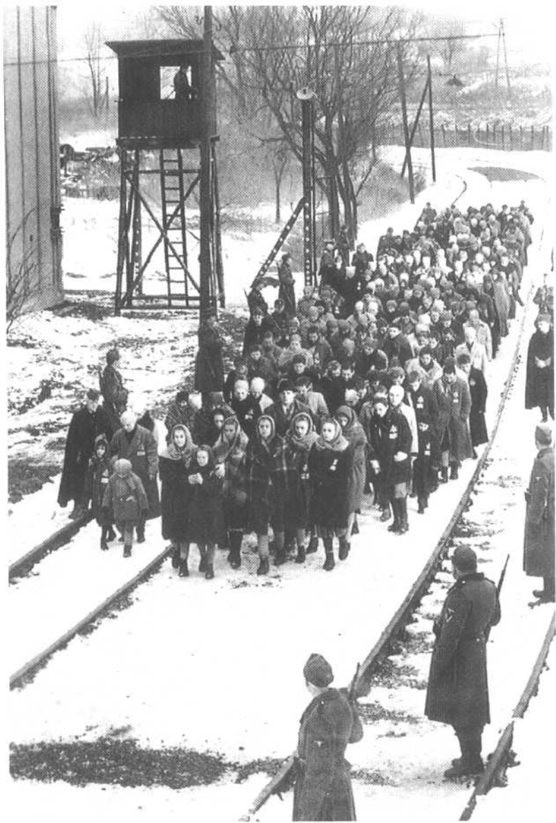
辛德勒不顾一切,从终结营带回他的犹太人。