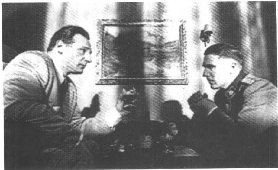
辛德勒为拯救犹太人而周旋于纳粹高层。