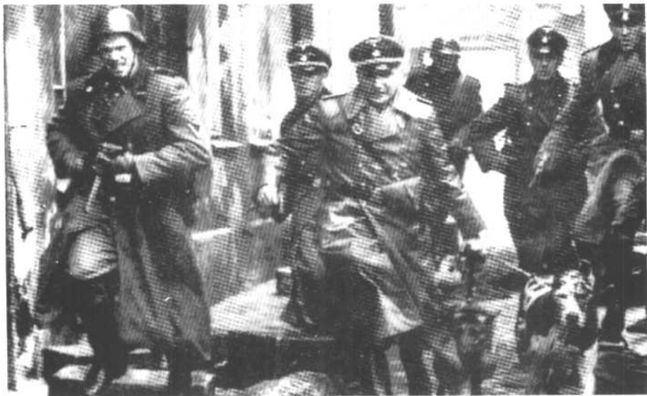
戈特率领士兵摧毁犹太聚居区。