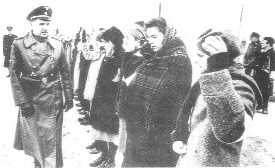
戈特像选牲口一样选择女仆。