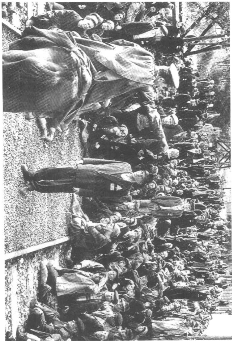
犹太人终于迎了解放。