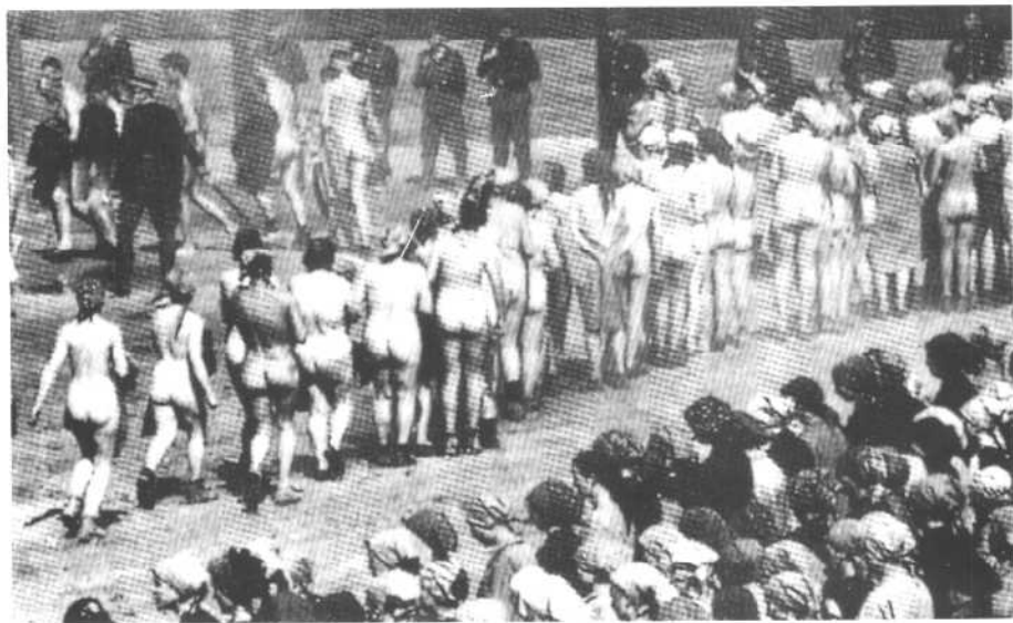
“死亡探戈”在这里看女人全裸毫无美感可言。