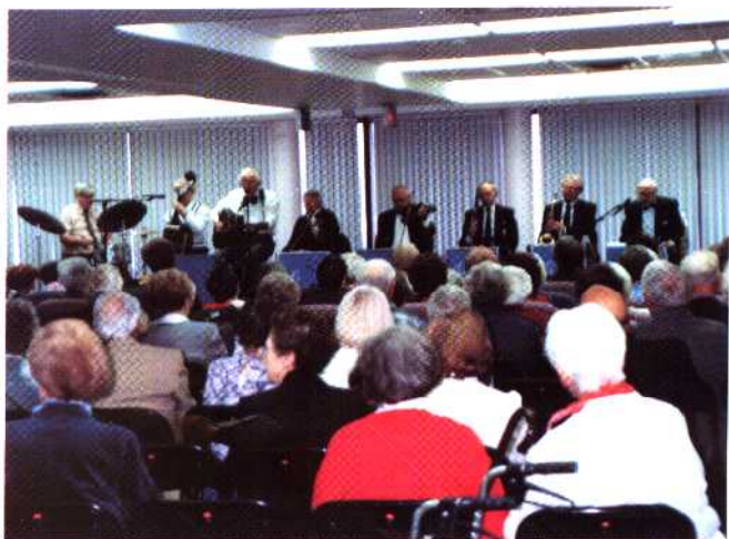
“好朋友俱乐部”的生日庆祝会