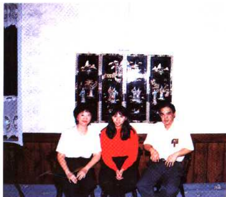
瀑布城里一酒家的店主一家