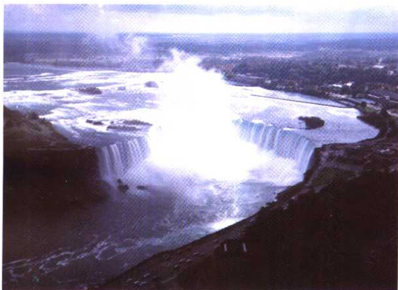
尼亚加拉大瀑布的马蹄瀑布