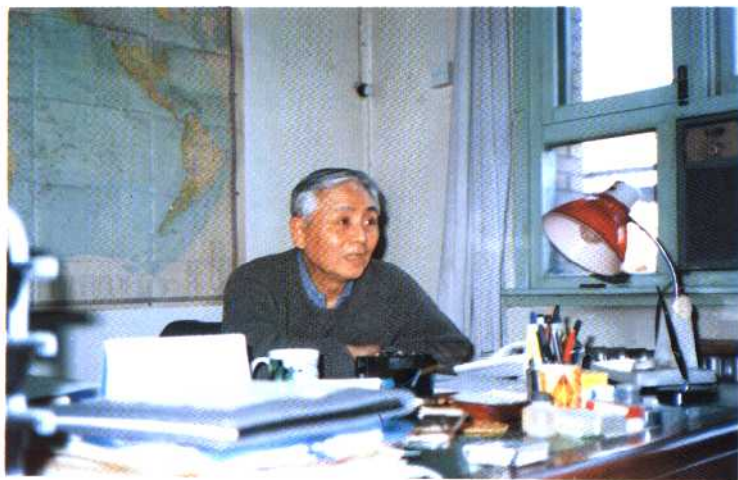
中国人民外交学会副会长、前驻加大使张文朴先生