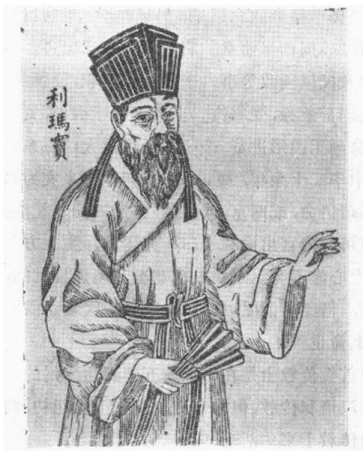
天主教耶稣会士利玛窦(1552—1610)

先后到南雄、江西的南昌、江苏的南京和苏州等地活动，并与地方官吏和士大夫结交。利玛窦发现，在他与中国官方和文人交往的过程中，身披和尚袈裟反而诸多不便。于是从一五九四年起，他改穿儒服，戴上儒冠，并自称是儒者。