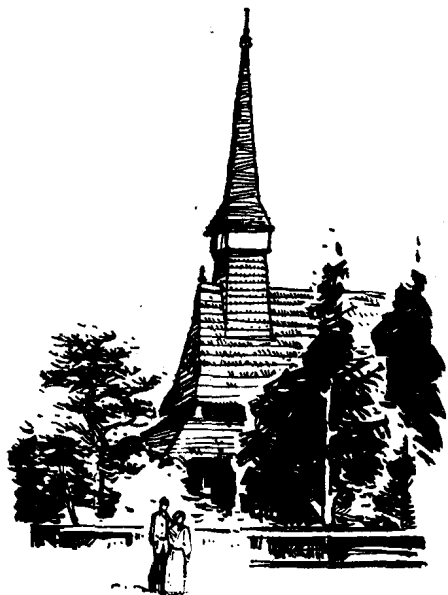
图②A 乡村博物馆的木教堂 农奴家屋，是用树枝和泥巴盖的房子，低矮阴暗，房子中央

“赫雷斯特留公园”位于城北部，是布市最大的公园，面积185公顷。公园里有直径180米的圆形展览馆、3000座位的露天剧场、众多的餐馆和运动场等。公园的中心有许多国内外名作家、名科学家的半身大理石塑像。公园绿树成荫，四季常青，花房中植花1200万株，游人络绎不绝。