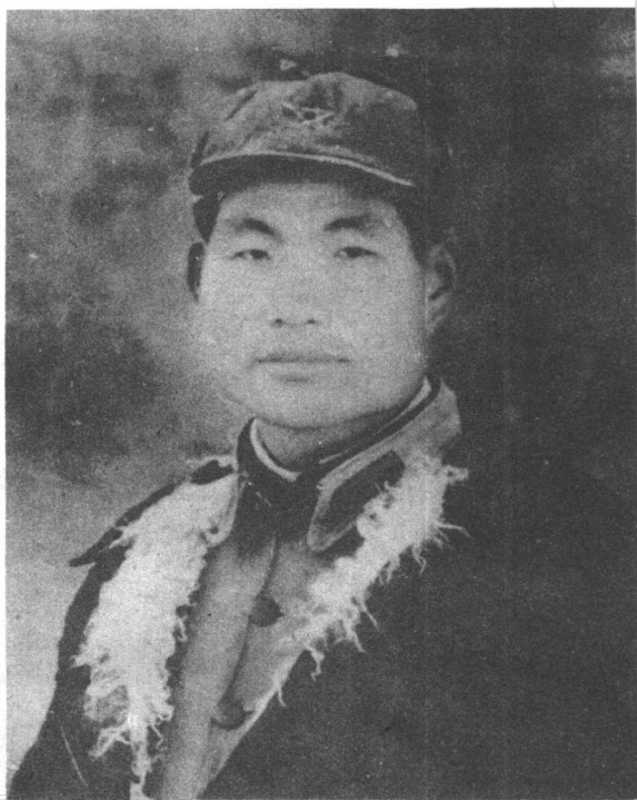
→ 长征到陕 北时的肖劲光