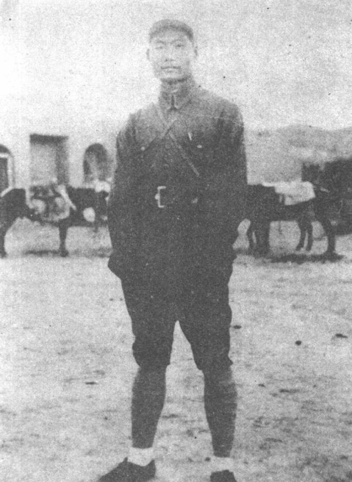
← 1936年任陕甘省委军事部长、红二十九军军长的肖劲光。