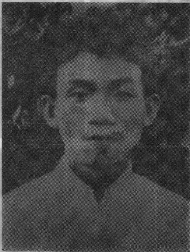
郁达夫像 一九二七年摄于上海

1936年12月12日（即十二月九日）在上海（即北平）举行的 青年救国团的成立大会（即青年救国团的成立大会） 会上，郁达夫（即郁达夫）发表了讲话（即郁达夫发表了讲话）