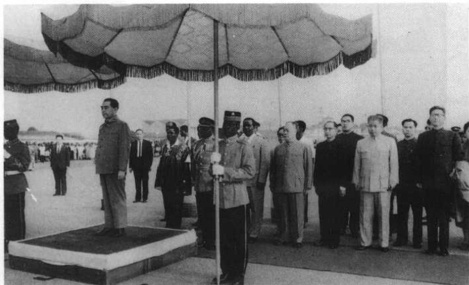
1964年1月，周恩来总理和陈毅副总理访问加纳时检阅仪仗队