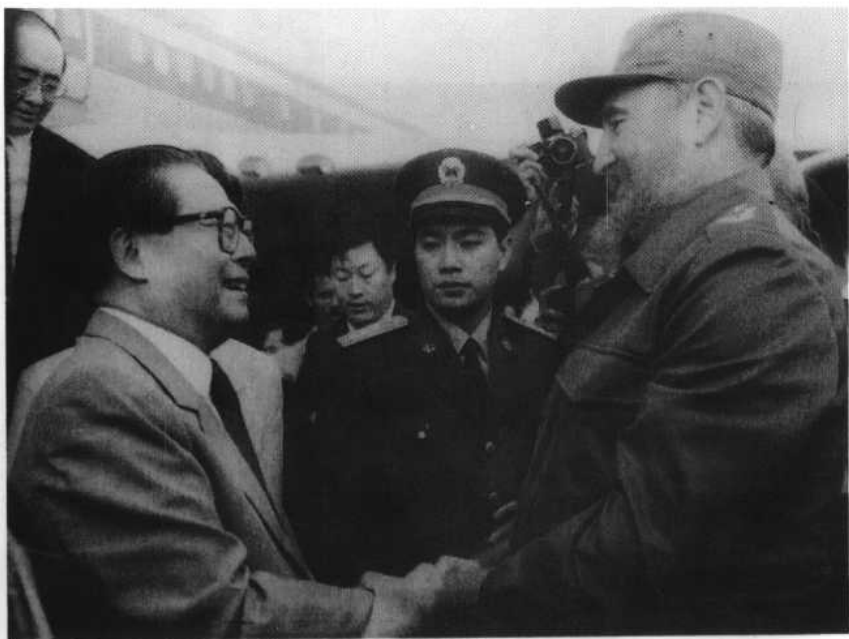
1993年11月21日，江泽民主席访问古巴时，受到古巴 国家委员会主席菲德尔·卡斯特罗的热烈欢迎