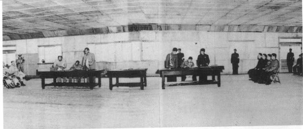
1953年7月27日,朝鲜停战协定及真临时补充协议在板门店签字

1985年2月20日,中国首次南极考察队在南极洲设得兰群岛的乔治王岛上建成的中国南极长城站