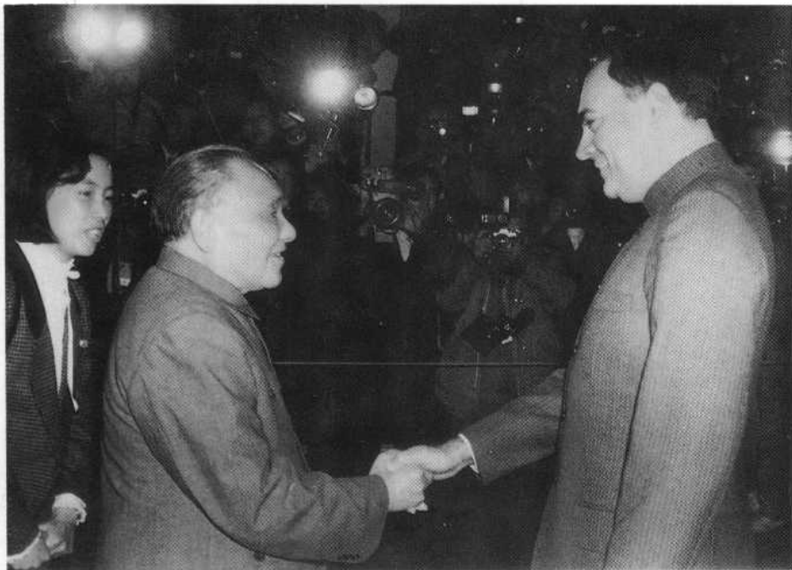
1988年12月，中央军委主席邓小平在北京 会见印度总理拉吉夫·甘地