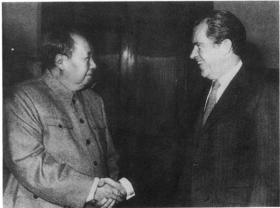
1972年2月，毛主席在中南海会见美国总统尼克松