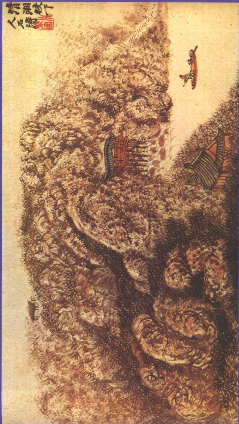
清石濤「清湘老人山水畫冊」之一——中國山水畫往往也在表現道家嚮往的境界。