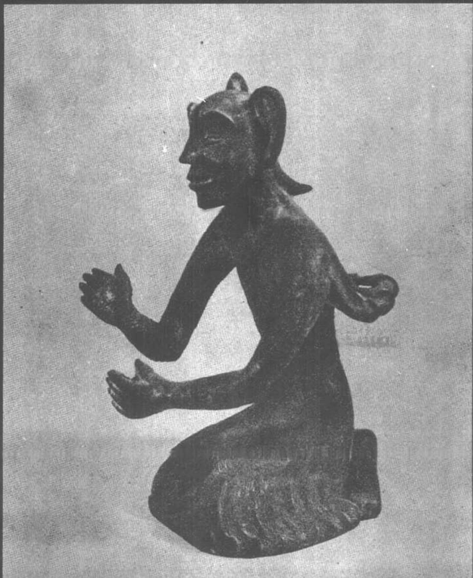
■銅羽人(西漢)——《抱朴子》提及有翼仙人，在漢代文物中常可見之。