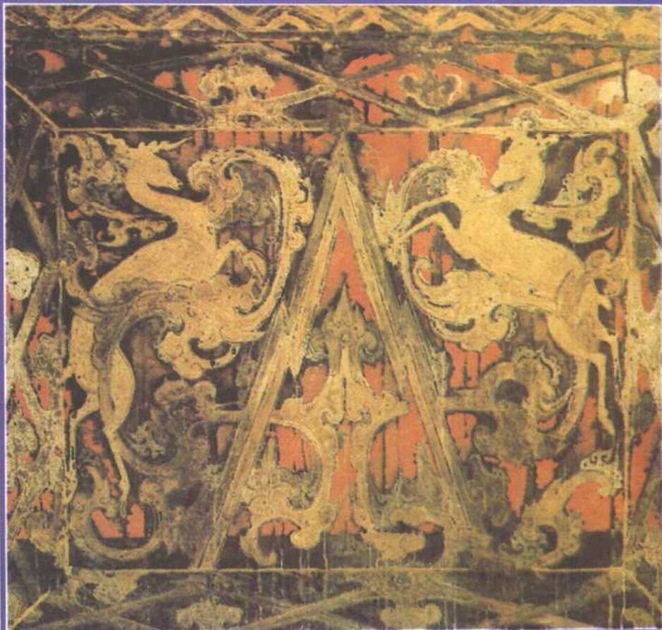
■長沙馬王堆西漢墓漆畫——二靈獸騰雲屬於仙山兩旁，表現登仙境界。