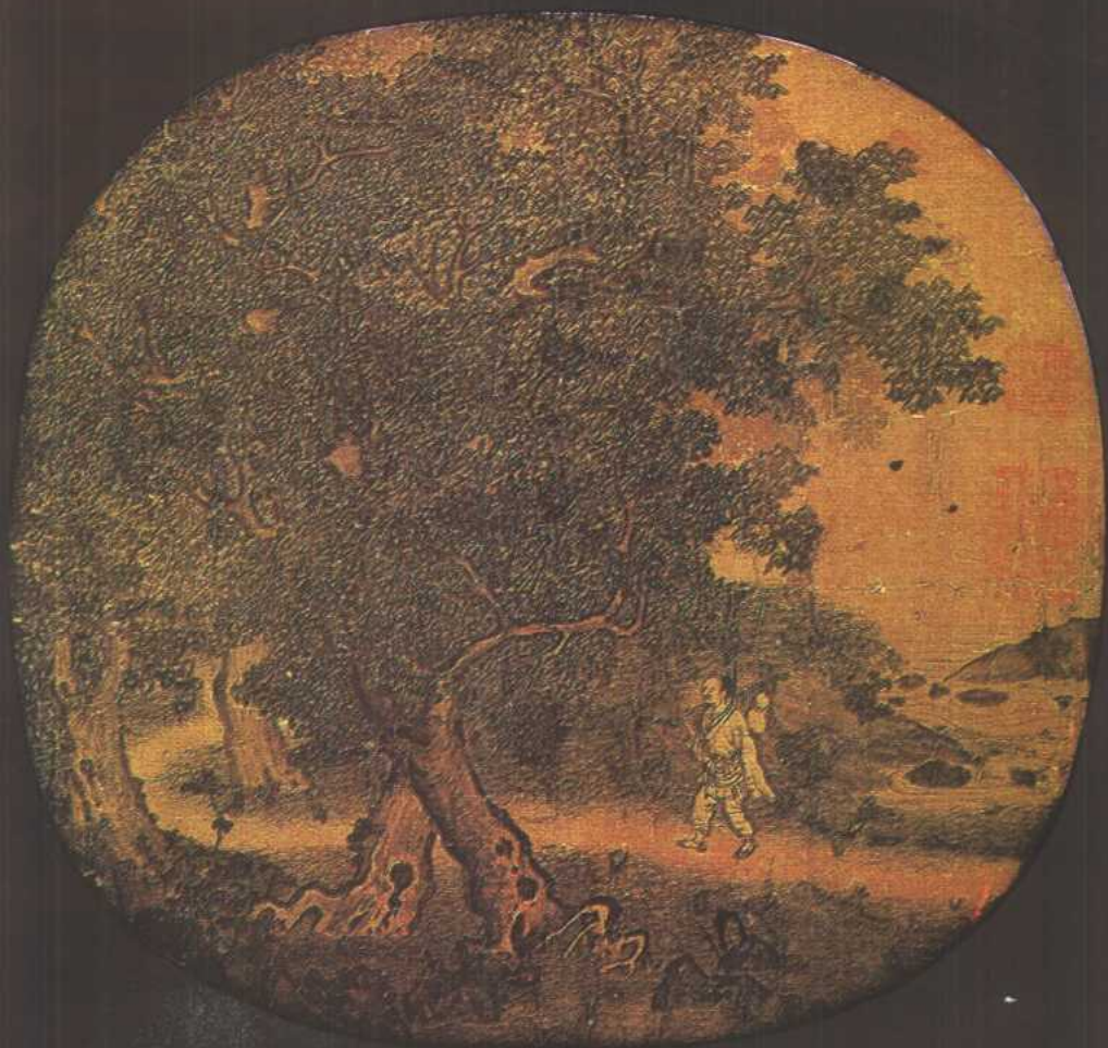
■ 宋代李唐「仙巖采藥」 山人背壺採藥，小徑走向密林。