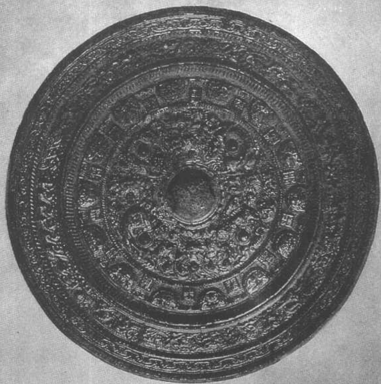
■神獸鏡(有南齊建武五年銘) 「抱朴子」記述入山需攜帶銅鏡以防邪·即有「照妖」作用