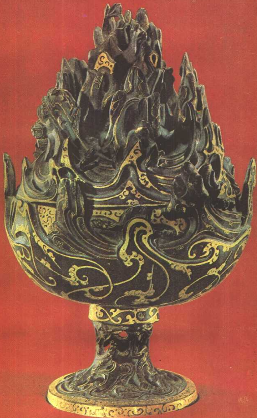
■西漢錯金博山爐—海水雲煙，窺窬仙山，瀛獸、仙人互為追逐，表現古人對仙境之嚮往。