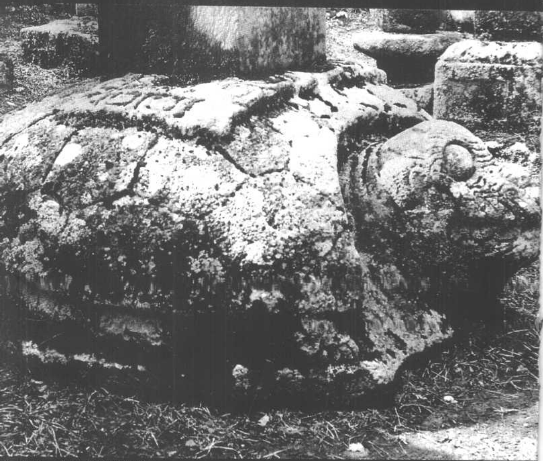
■龜趺——龜是長壽的象徵