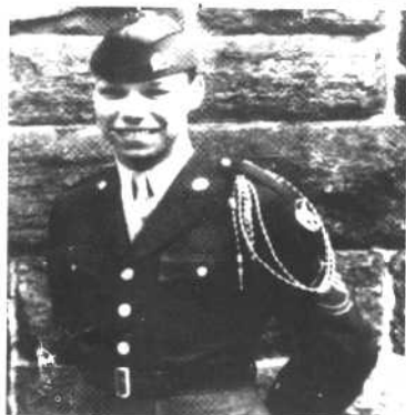
后备军官训练团成员