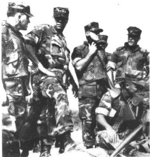
海湾战争时，鲍威尔在分析战情