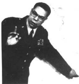
鲍威尔视察海湾战场