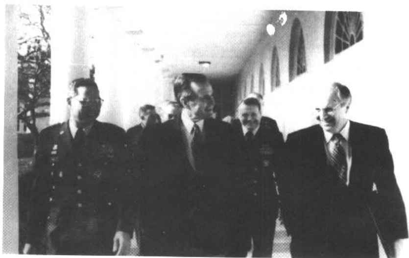
与布什、切尼在一起