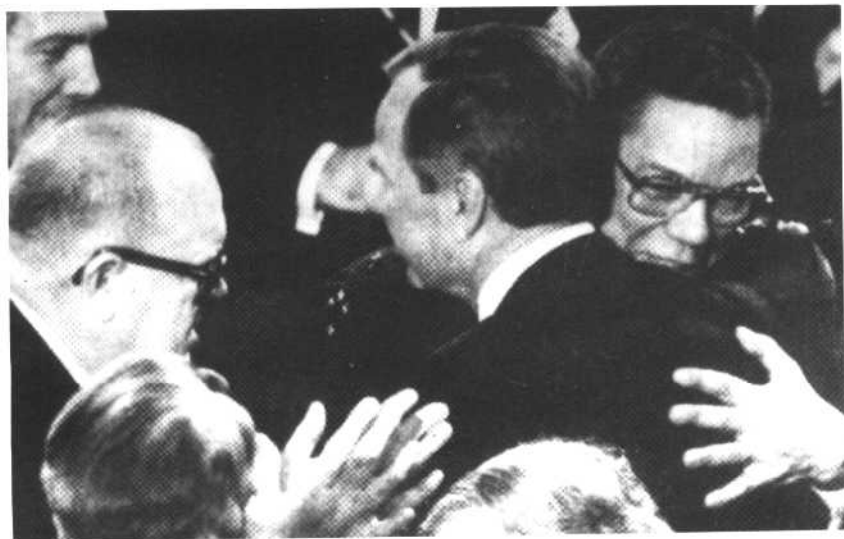
海湾战争胜利时，与布什拥抱