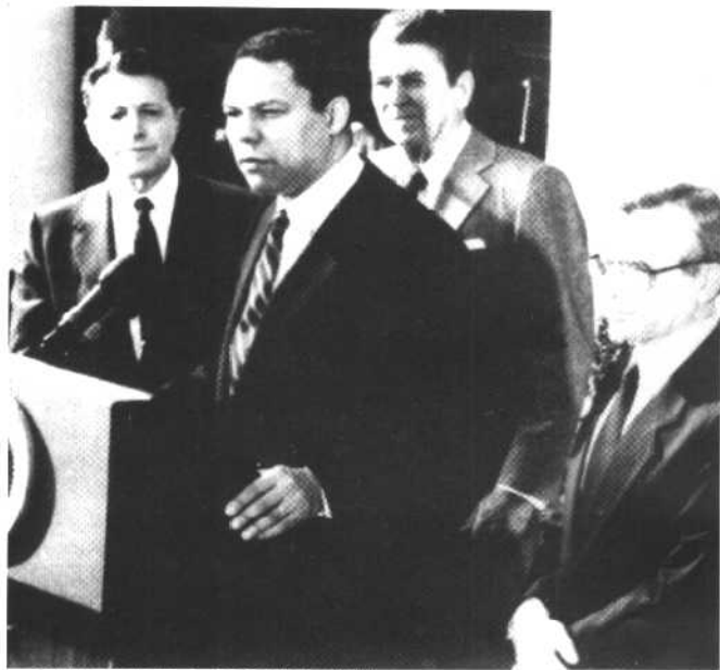
总统国家安全顾问就职典礼。