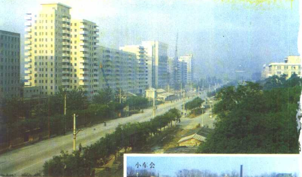
企 前门东大街新貌